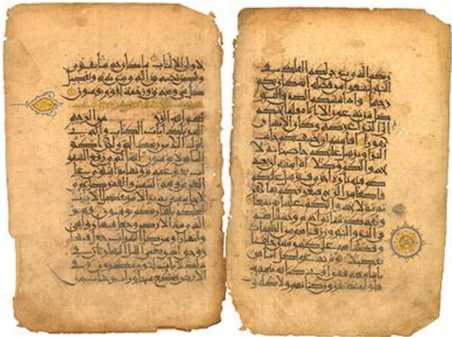
VII в. н.э. – Коран (записан со слов Мухаммеда со слов Аллаха).