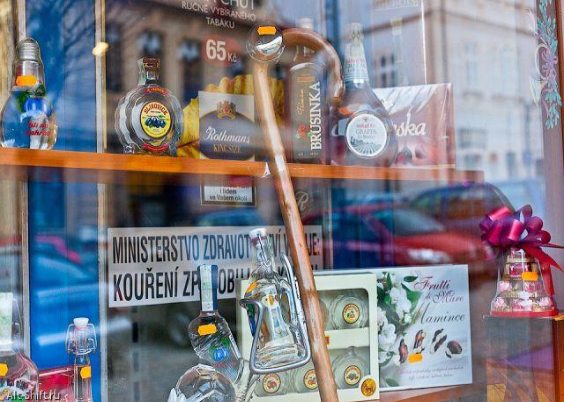
В витринах магазина попадаются очень интересные экземпляры трости.