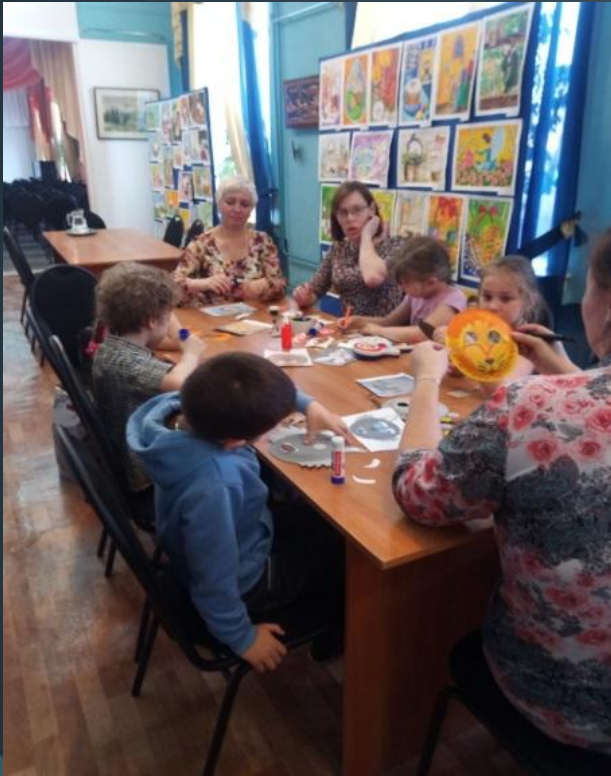
Музей города Черногорска