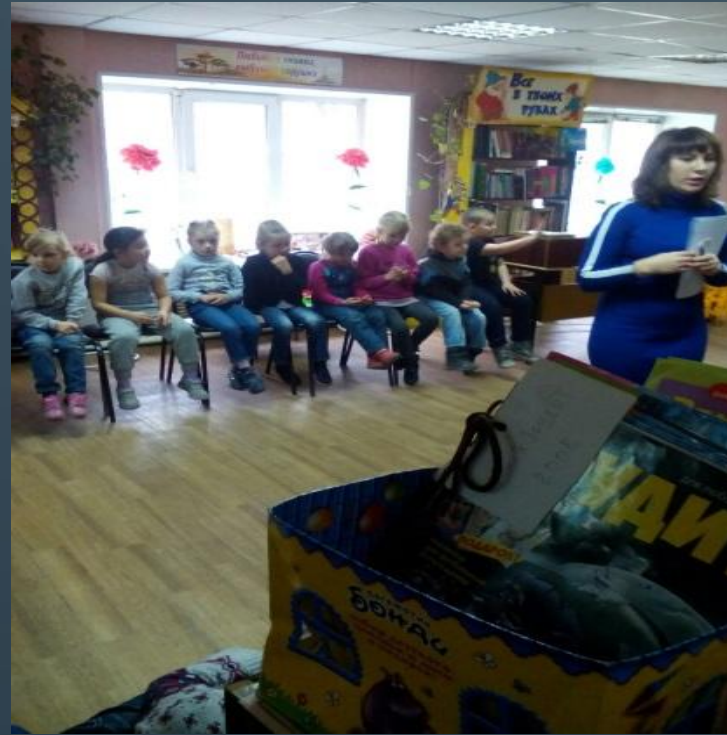
Библиотека филиал №6