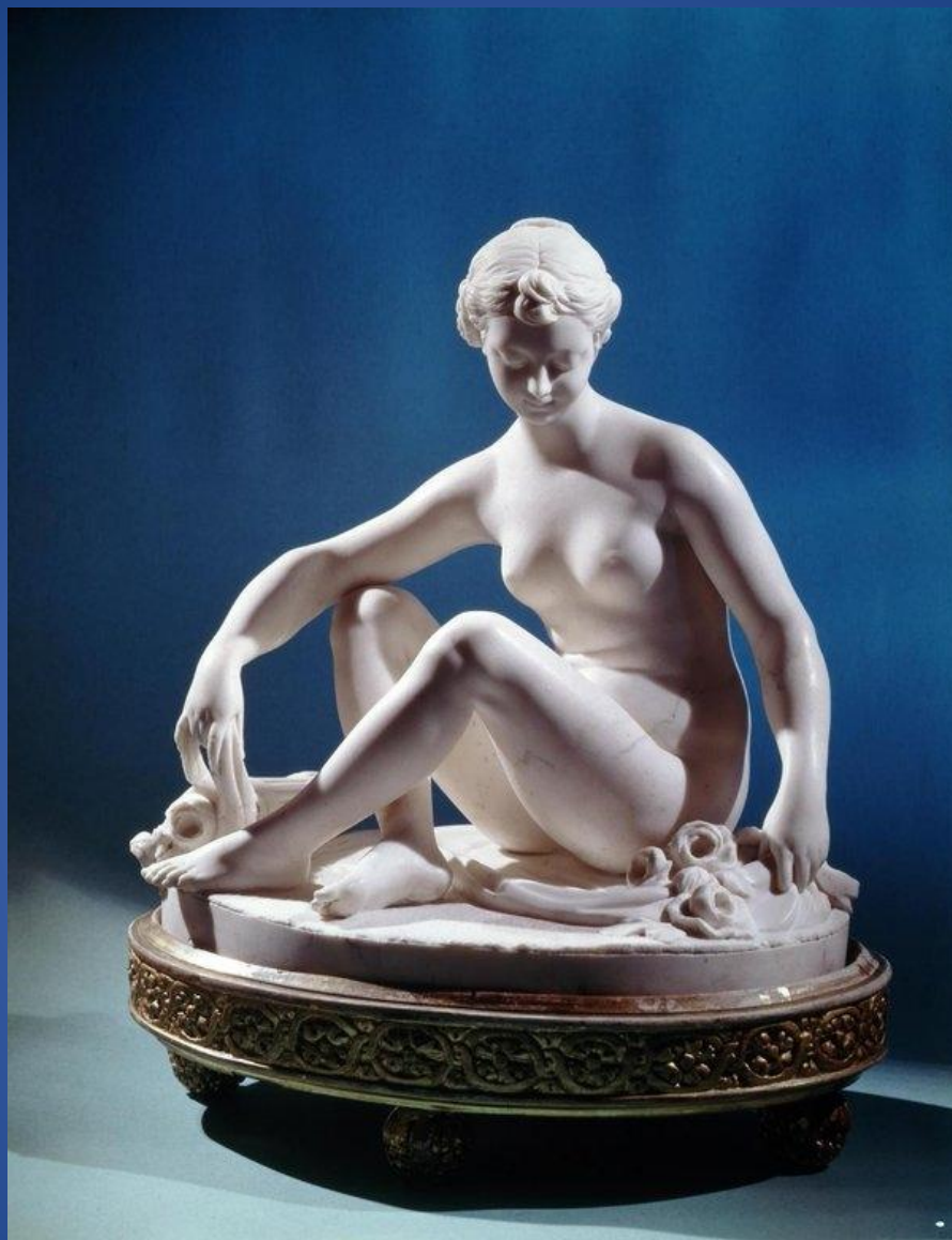
Этьен Морис Фальконе – «Флора»