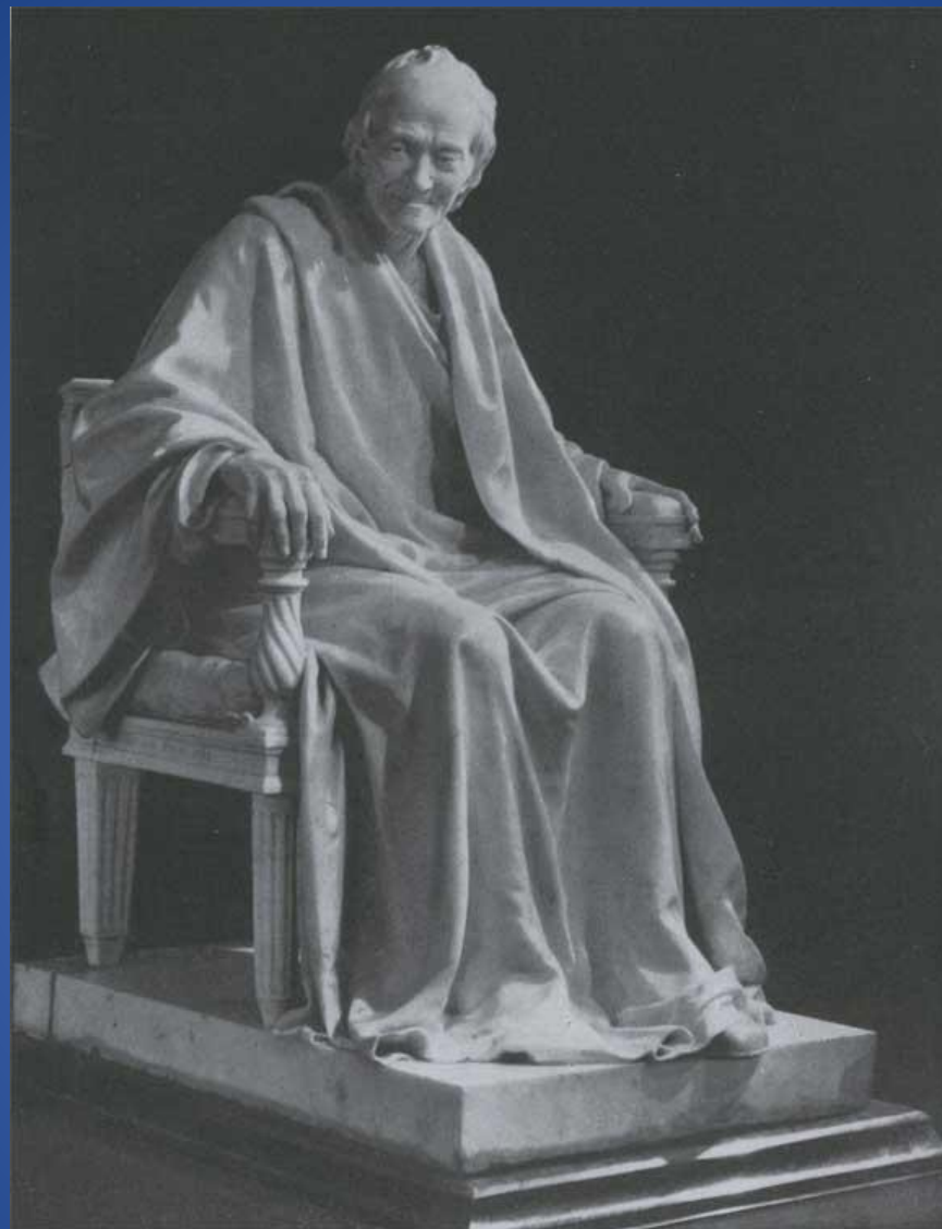
Жан-Антуан Гудон – «Вольтер»