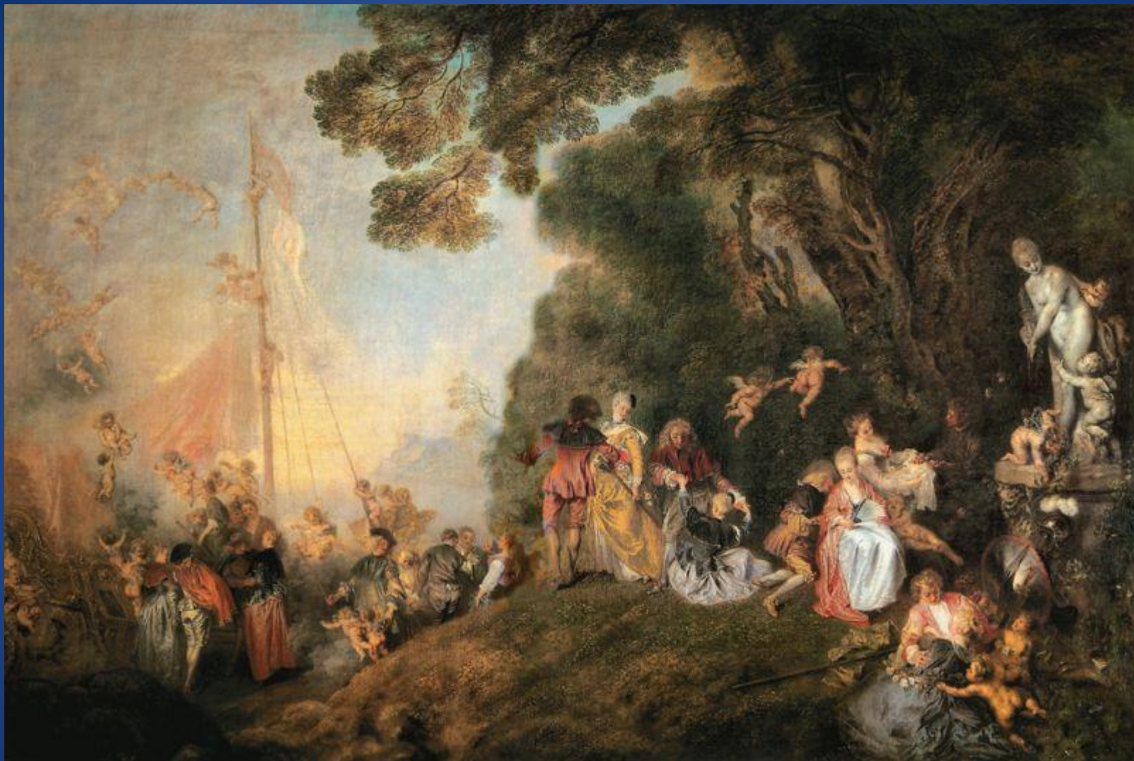
Жан-Антуан Ватто – «Отплытие на остров Цитеру»