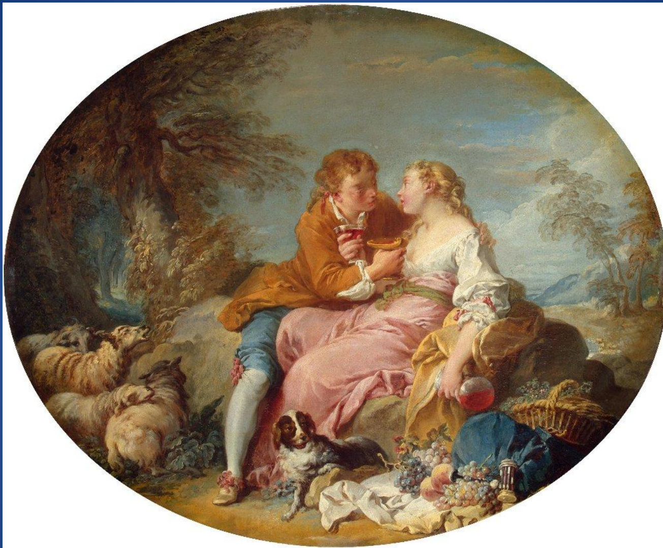
Франсуа Буше – «Пастушеская сценка»