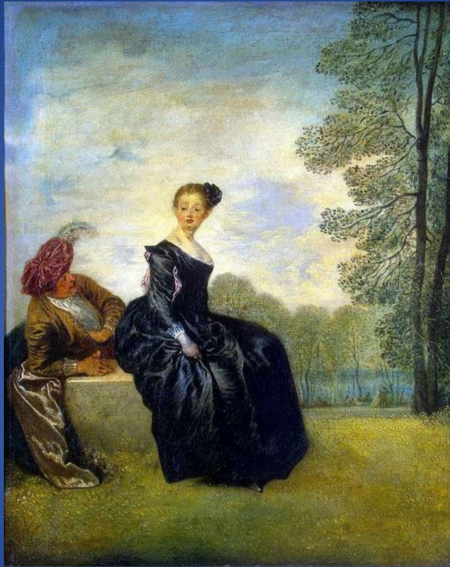
Жан-Антуан Ватто – «Капризница»