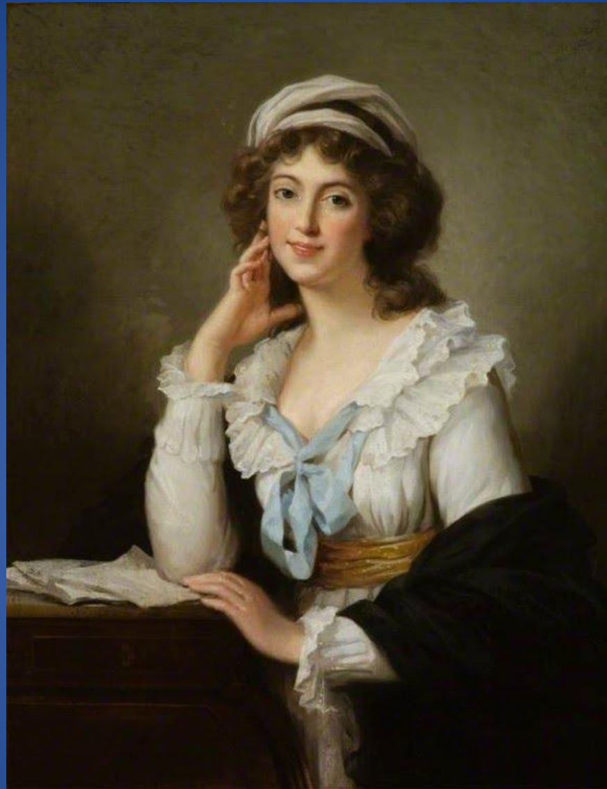
Мари-Элизабет-Луиза Виже-Лебрён – «Женский портрет»