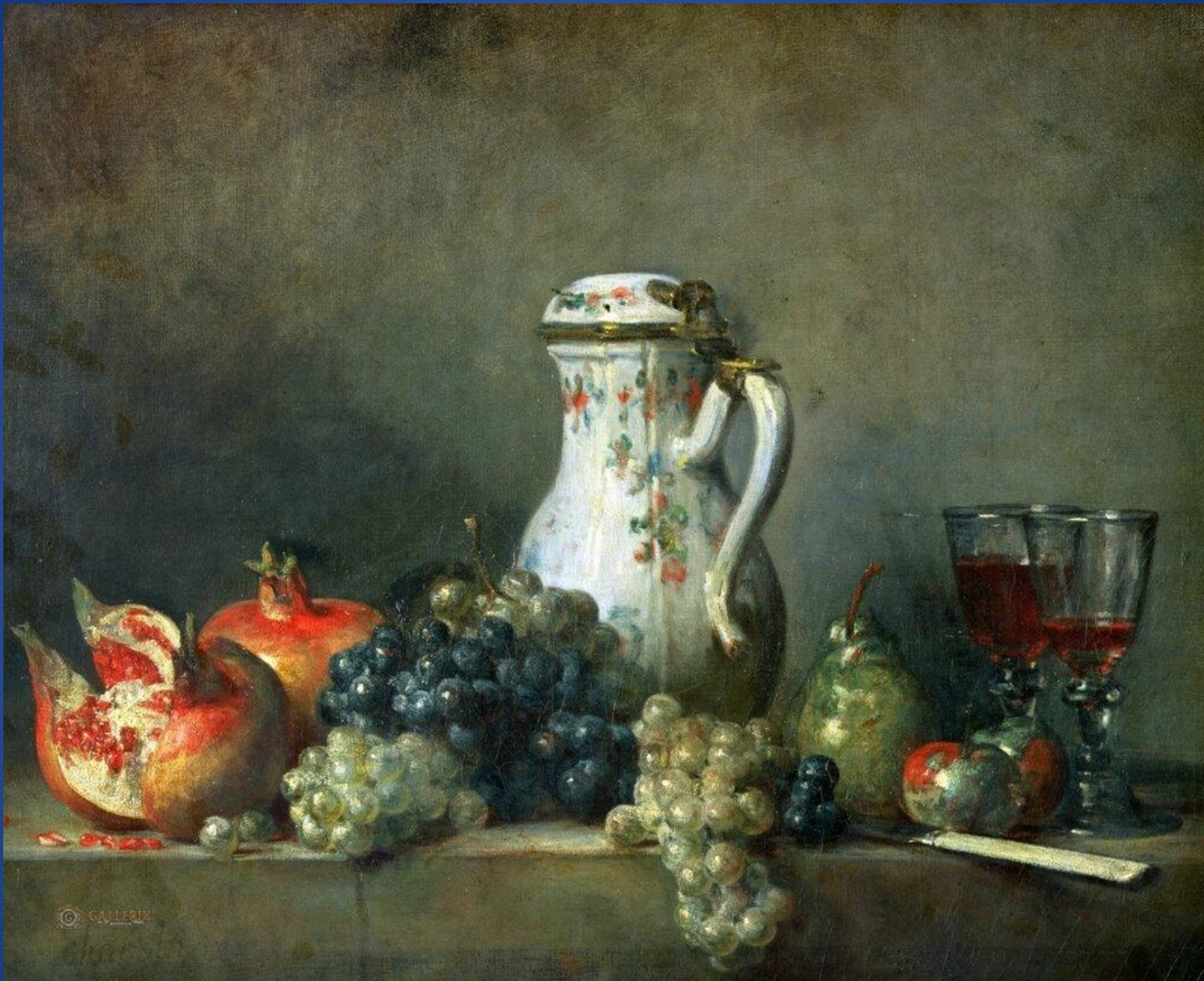
Жан-Батист-Симеон Шарден – «Натюрморт»