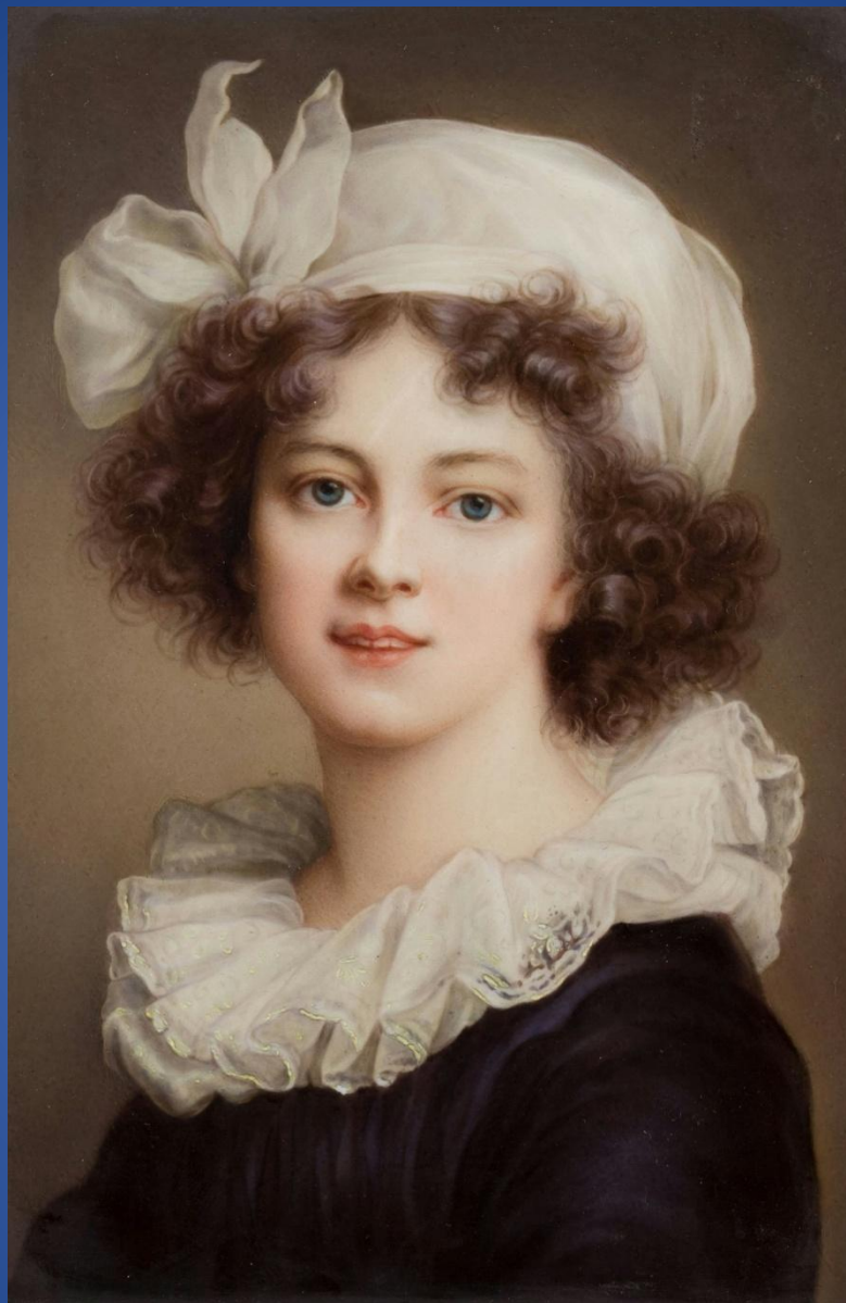
Мари-Элизабет-Луиза Виже-Лебрён – «Автопортрет»