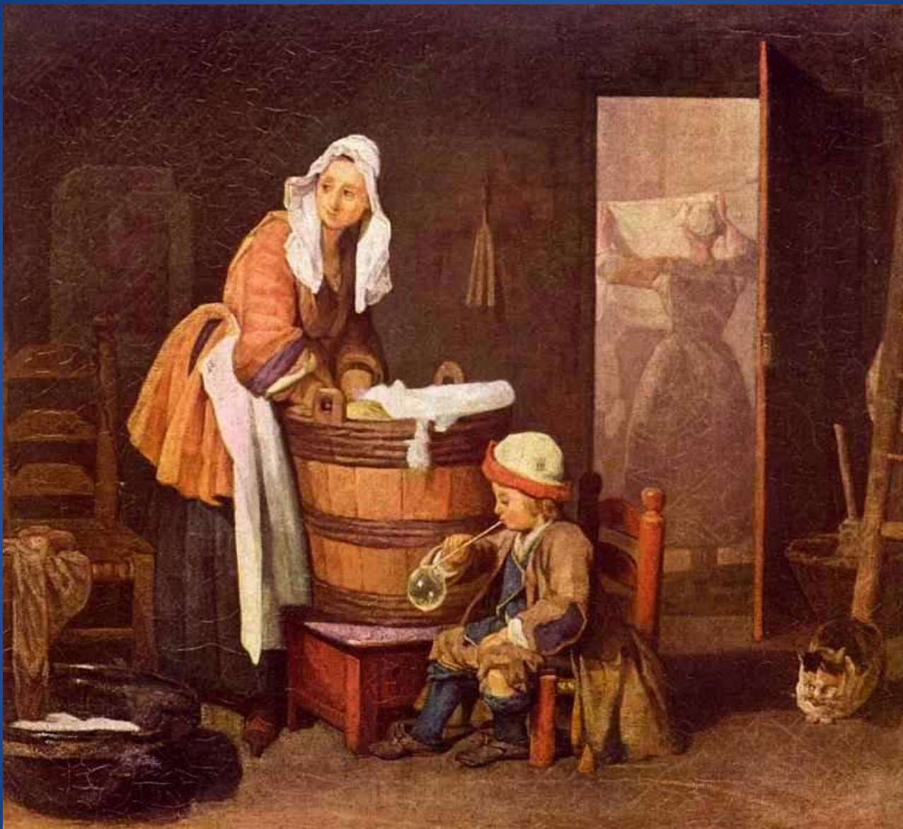
Жан-Батист-Симеон Шарден – «Прачки»