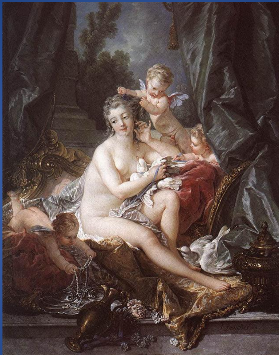
Франсуа Буше – «Туалет Венеры»