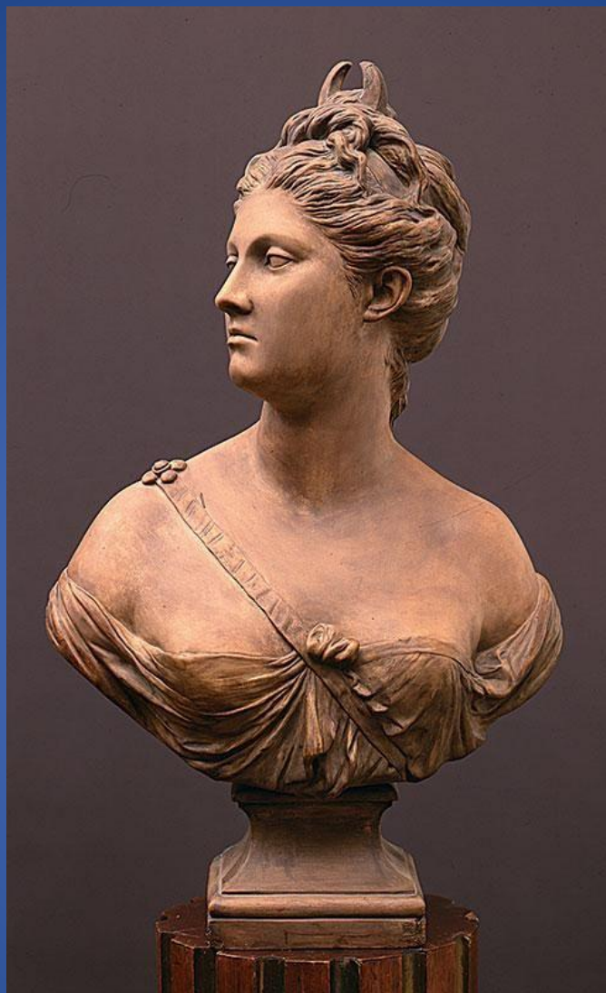
Жан-Антуан Гудон – «Женский портрет»