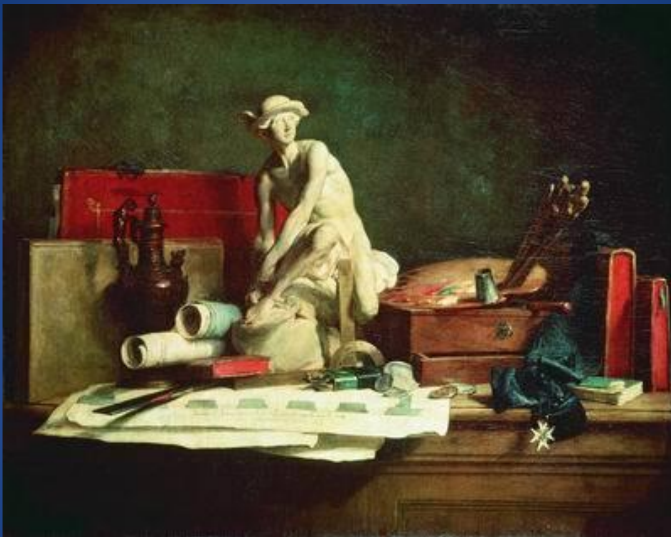
Жан-Батист-Симеон Шарден – «Натюрморт с атрибутами искусства»