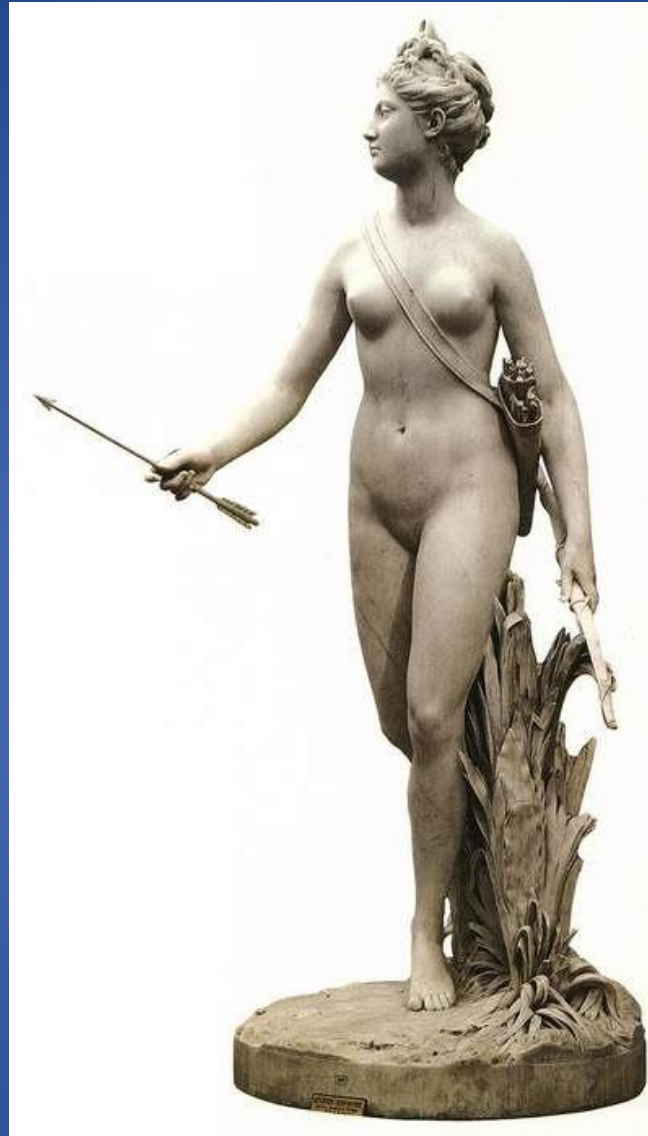
Жан-Антуан Гудон – «Диана»