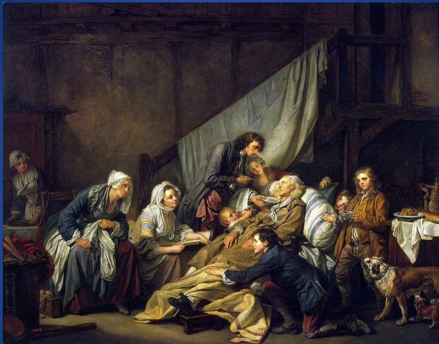
Жан-Батист Грёз – «Паралитик»