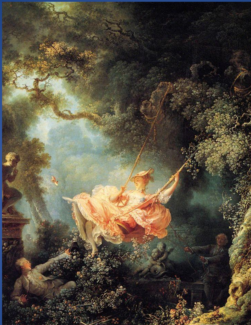
Жан-Оноре Фрагонар – «Счастливые возможности качелей»