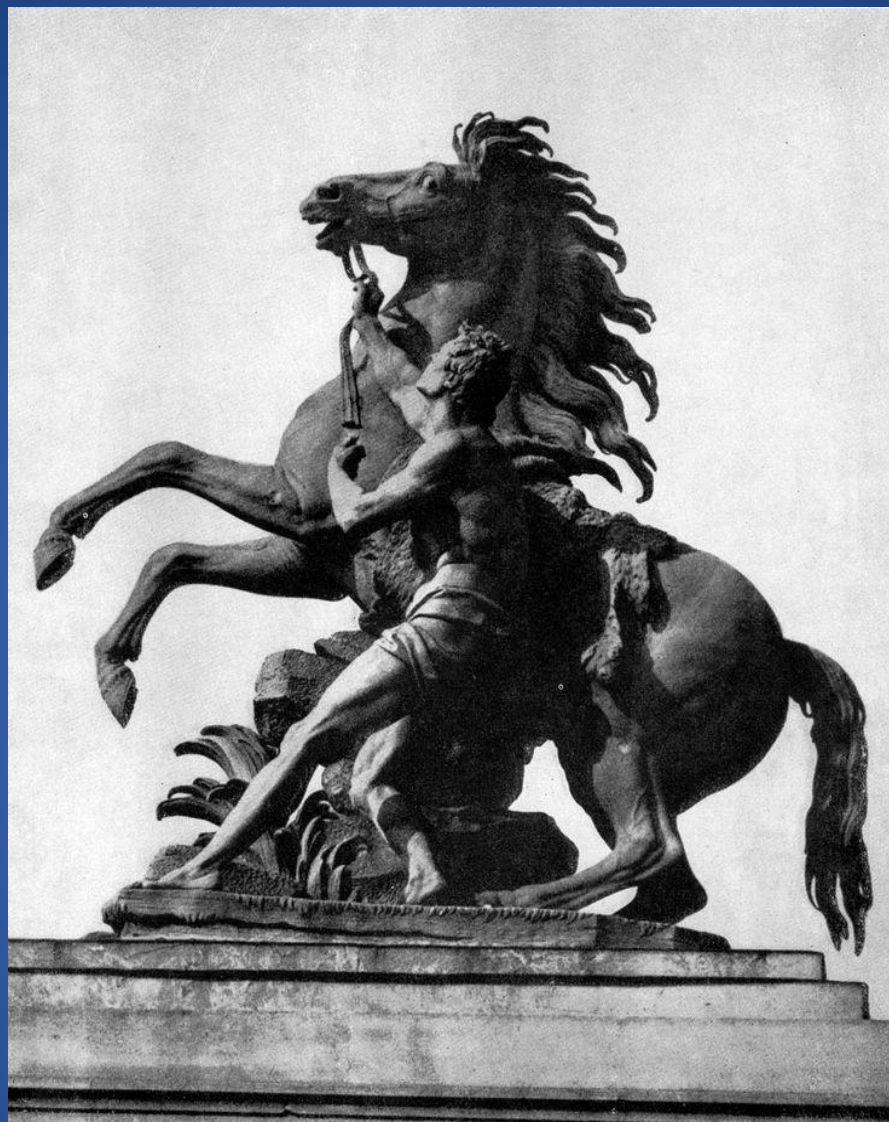
Гийом Кусту-старший – «Укротители коней»