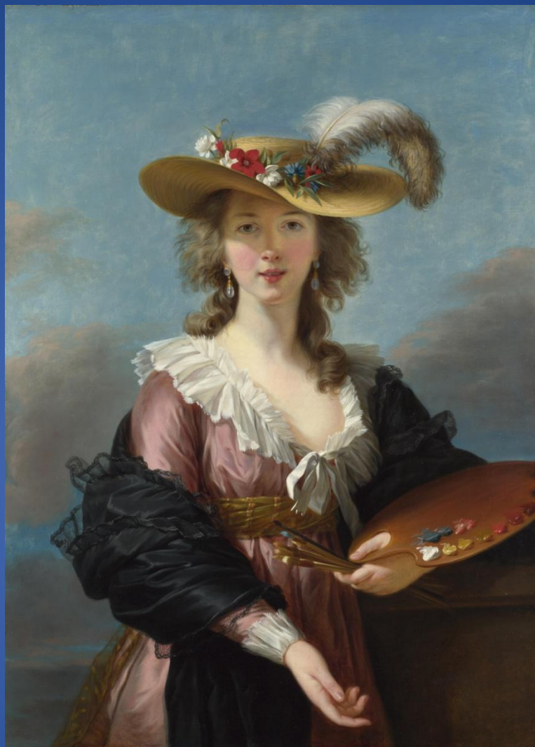
Мари-Элизабет-Луиза Виже-Лебрён – «Автопортрет в соломенной шляпке»