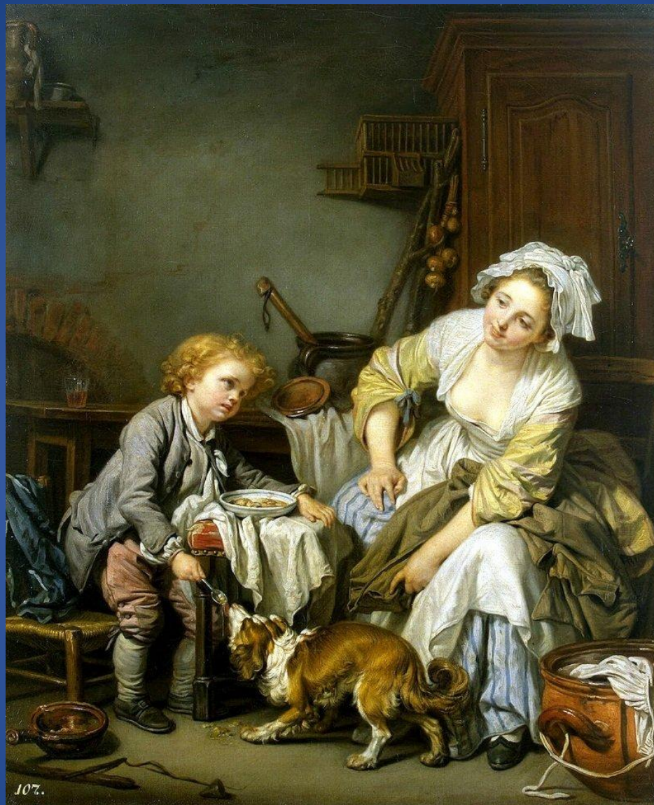
Жан-Батист Грёз – «Балованное дитя»