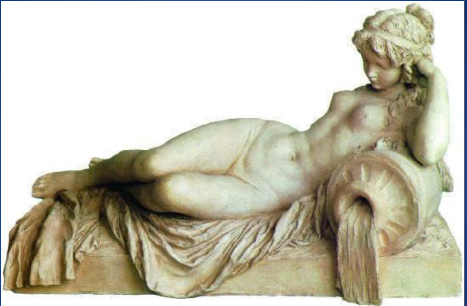
Клод Мишель (Клодион) – «Речная нимфа»