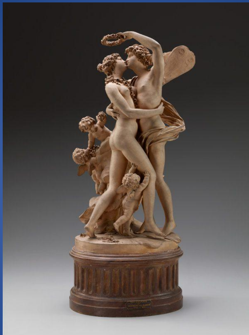
Клод Мишель (Клодион) – «Зефир и Флора»