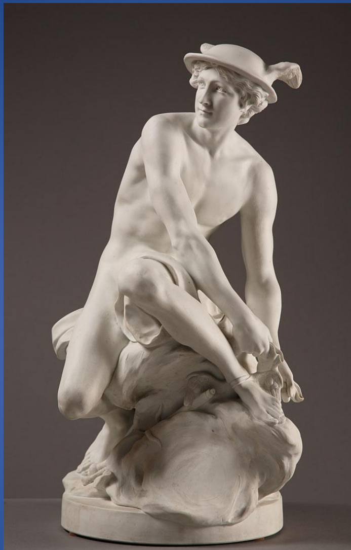
Жан-Батист Пигаль – «Меркурий, завязывающий сандалию»