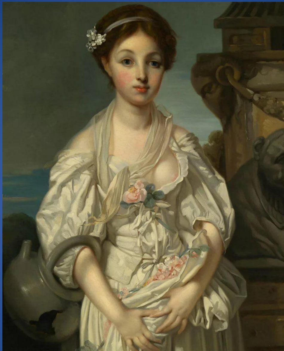
Жан-Батист Грёз – «Разбитый кувшин»