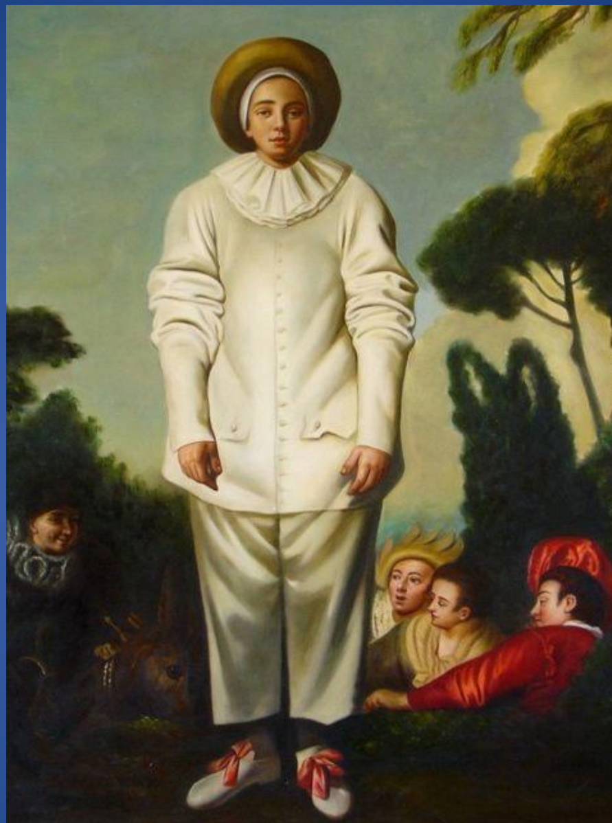
Жан-Антуан Ватто – «Жиль Пьеро»