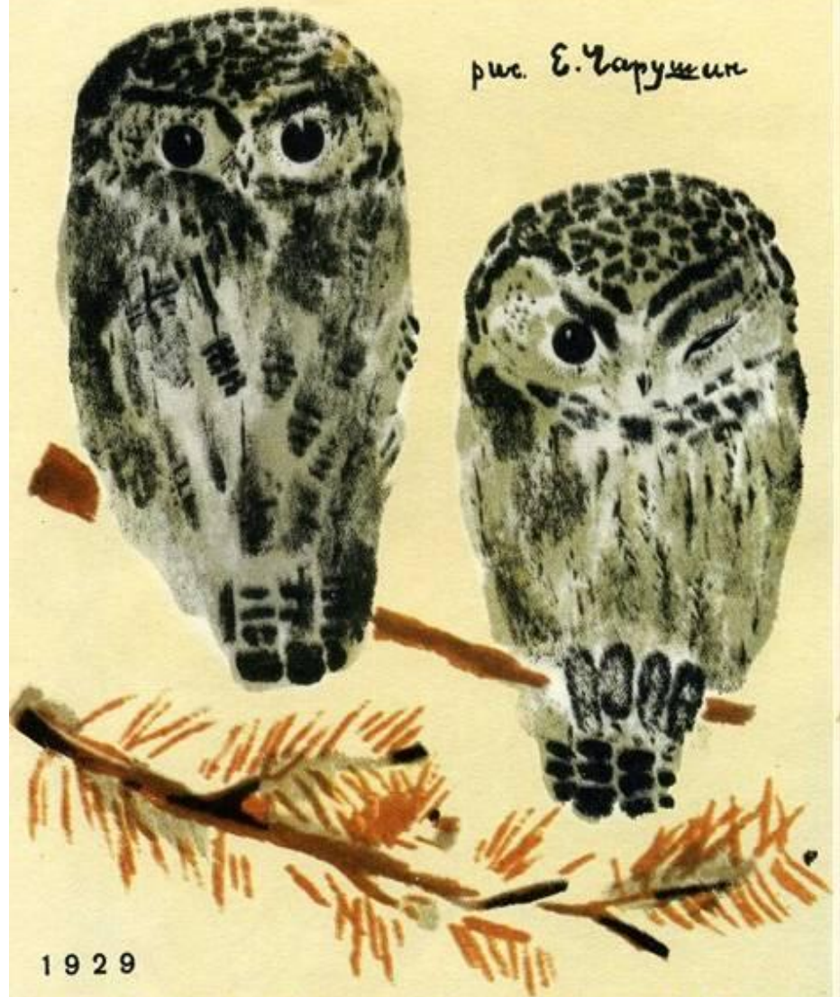
рис. Е. Чарушин