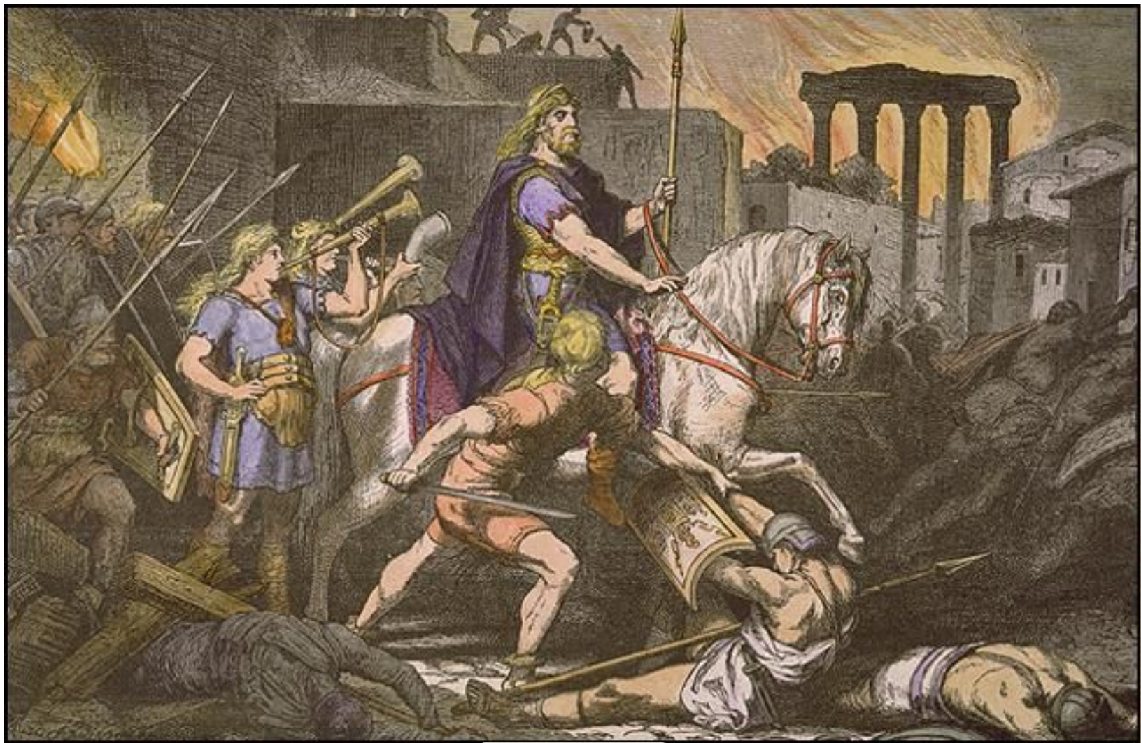
Вход Алариха в Рим.