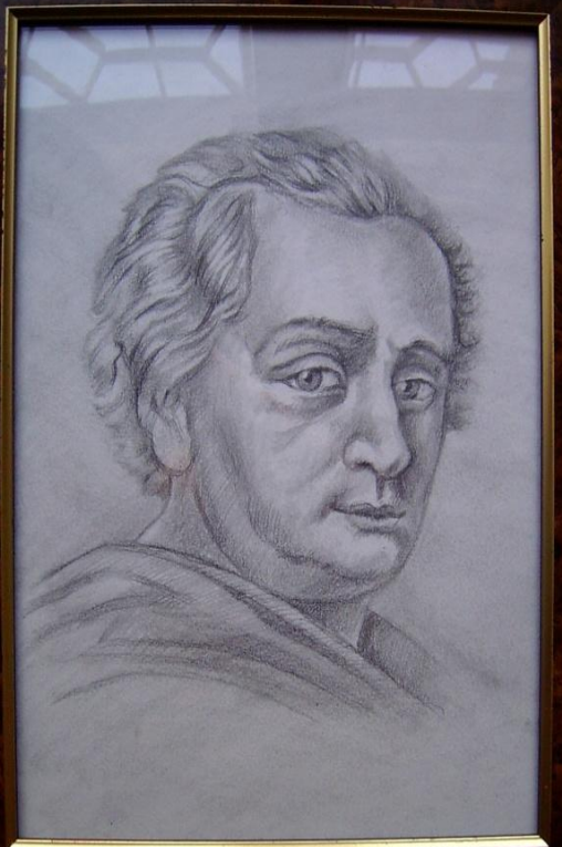
Чезаре Беккариа (1738-1794)