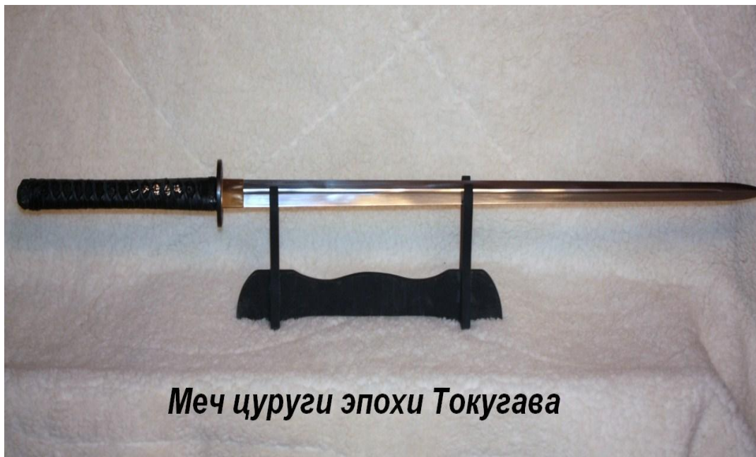
Меч цуруги эпохи Токугава