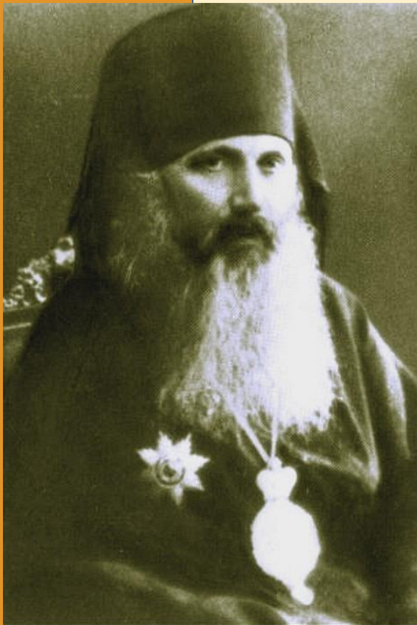
епископ Сильвестр Ольшевский

Иустин Львович Ольшевский принял монашеский постриг с наречением имени Сильвестра только в 50 лет. А до этого вел жизнь монаха в миру. Когда 1892 году по разрешению Святейшего синода в виде исключения его посвятили во священники в сущем состоянии, то есть неженатом, духовенство поразному отреагировало на этот жизненный шаг святителя