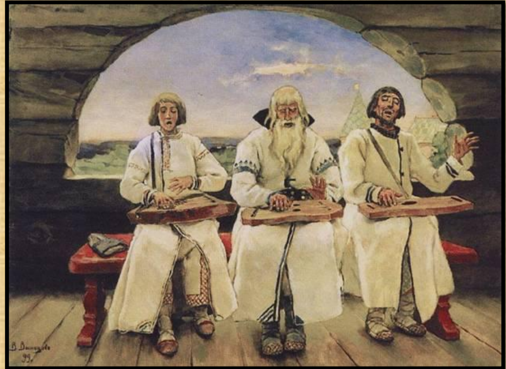
«Гусляры» Васнецов В.М.

Другие жанры древнерусского фольклора: пословицы, поговорки, загадки, предания, легенды, мифы, былины и др. Одной из ключевых особенностей русского фольклора – его устность. Собирать устное народное творчество, то есть записывать, начали только в 18 веке.