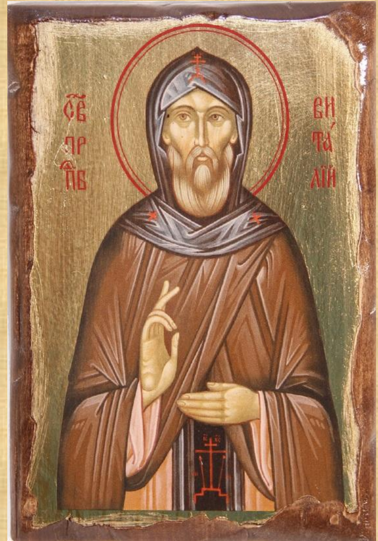
Святой Виталий Александрийский

Икону богато украшали золотом, серебром и драгоценными камнями. Она вдохновляла русских воинов на полях ратных сражений. В горнице для иконы отводили красный угол-самое почётное место в доме. Иконы украшали роскошные княжеские палаты и величественные своды белокаменных соборов, маленькие часовни для молитвы вдоль проезжих дорог и деревянные церквушки, затерявшиеся среди бесконечных лесов.