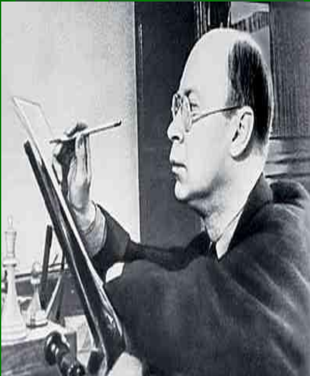
Сергей Сергеевич Прокофьев (1891-1953)