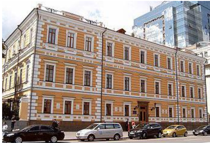
Приміщення президіуму НАН України в Києві