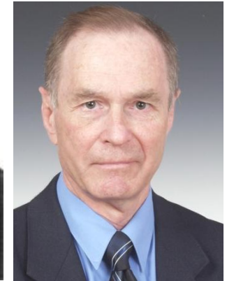
Перші віце-президенти НАН України Горбулін В.П. та Наумовець А.Г