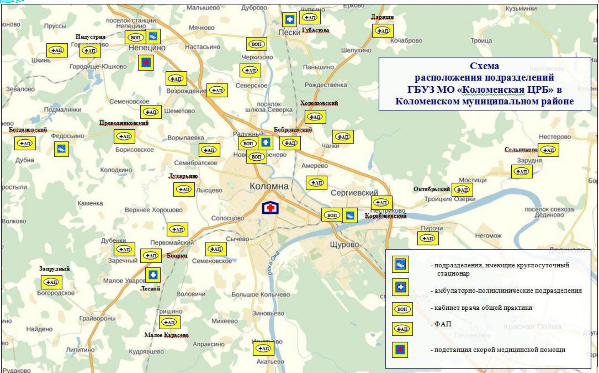
Схема расположения подразделений ГБУЗ МО «Коломенская ЦРБ» в Коломенском муниципальном районе