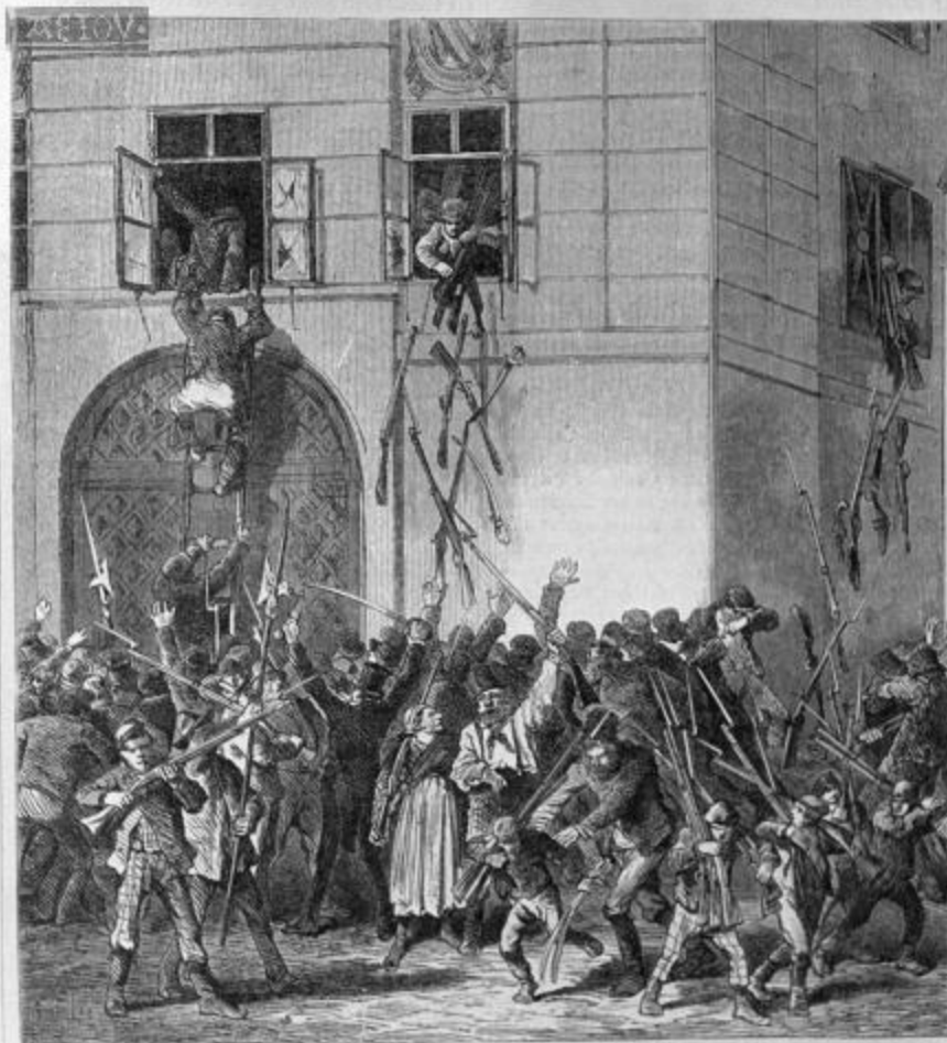
Гибельность при восстании в Париже.