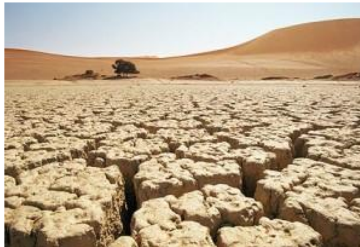
Последствие парникового эффекта