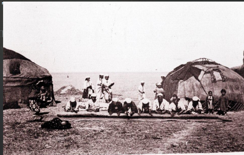
Валяние кошмы (войлока).

Алтын де, сол сияқты темір кенінің де өндірісі маңызды болды.