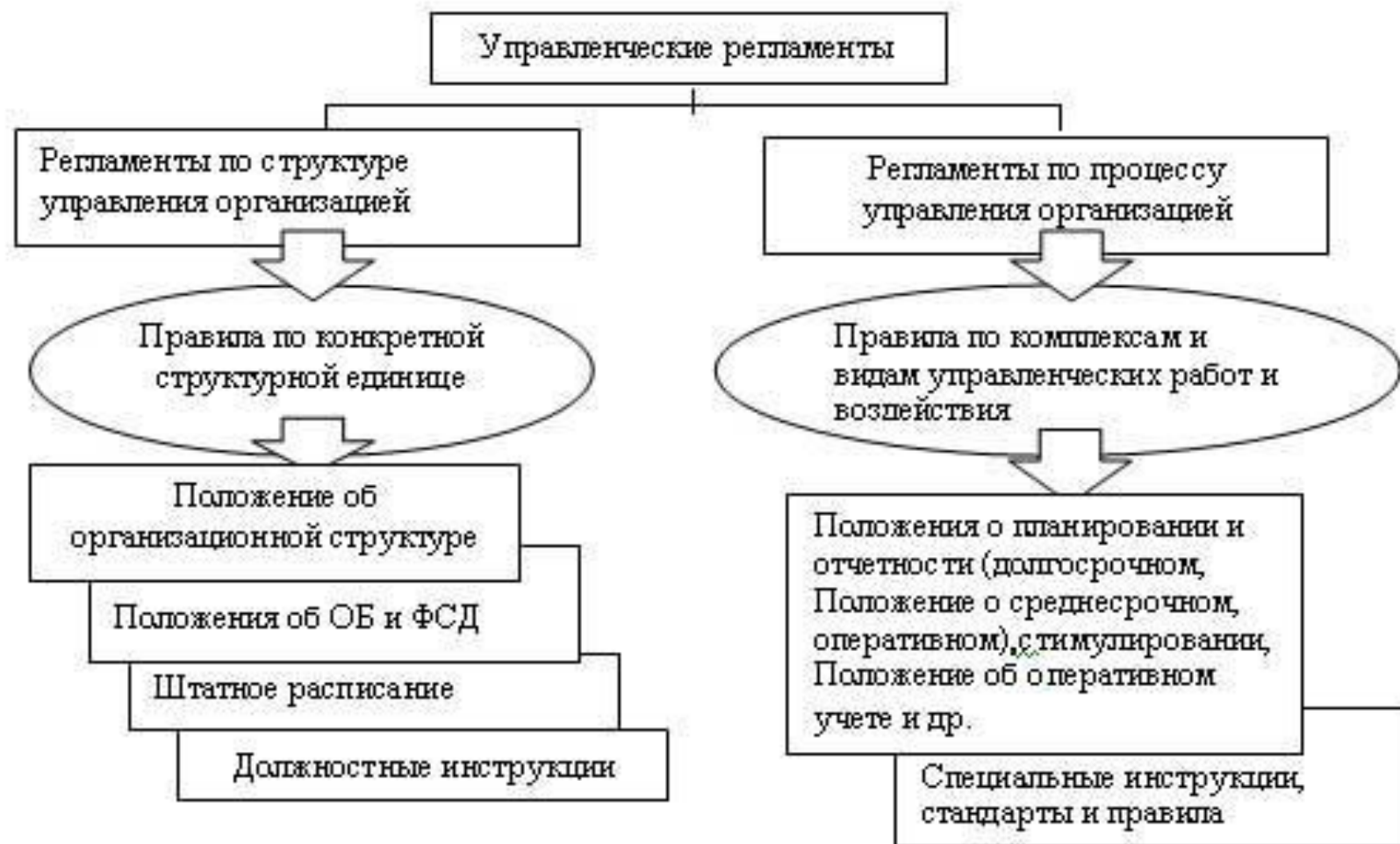
Структура регламентных документов