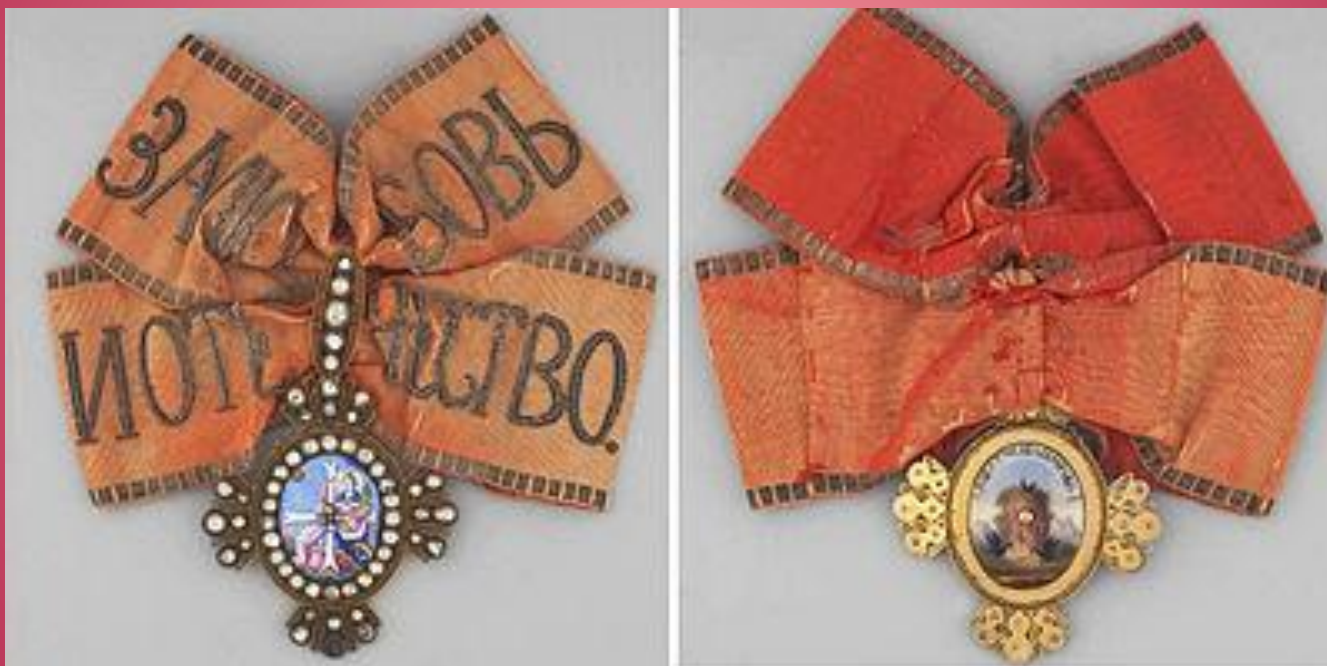
Знак к ордену Святой Екатерины (лицевая и обратная стороны)

Всего за два столетия орденом были награждены 734 дамы, из них более 310 удостоились 1-й степени