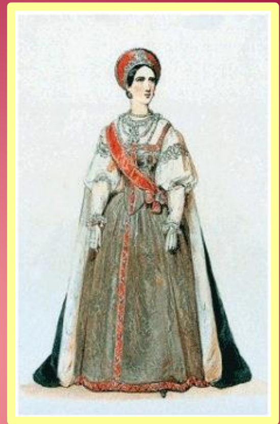
Кавалерственная дама Большого Креста ордена Св. Екатерины великомученицы. Наряд с цепью и по цветам ордена. Мантия для великих княгинь

ПРОЕКТЫ ОРДЕНСКИХ КОСТЮМОВ 1855 Г. НЕ БЫЛИ УТВЕРЖДЕНЫ