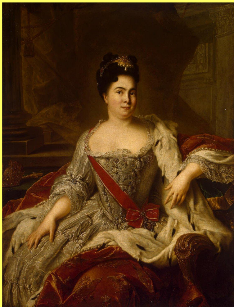
Екатерина I с орденом в честь самой себя в 1717 г.

Петр I торжественно наградил орденом свою жену Екатерину Алексеевну в день ее именин, 24 ноября 1714 года, и до 1726 года она оставалась единственной обладательницей этой награды.