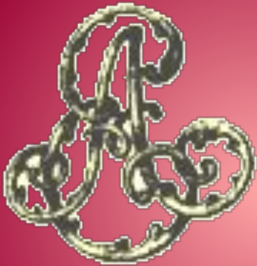
Изображение монограммы Екатерины I (супруга Петра I)

Моногра́мма (греч. μόνος — один, γράμμα — буква) — знак, составленный из соединённых между собой, поставленных рядом или переплетённых одна с другой начальных букв имени и фамилии или же из сокращения целого имени.