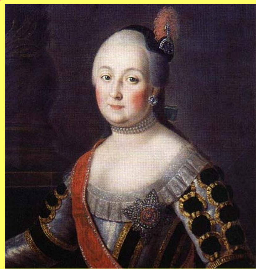
Статс-дама графиня Анна Карловна Воронцова в платье ордена Св. Екатерины. 1763 г.

Орденом могли быть награждены только лица дворянского происхождения.