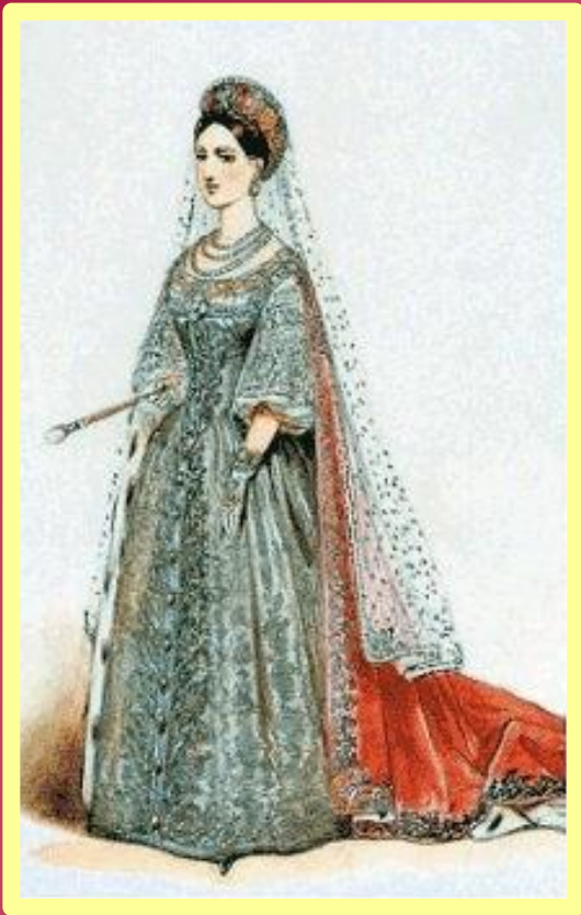
Кавалерственная дама Большого Креста ордена Св. Екатерины великомученицы. Наряд по старинной форме ордена