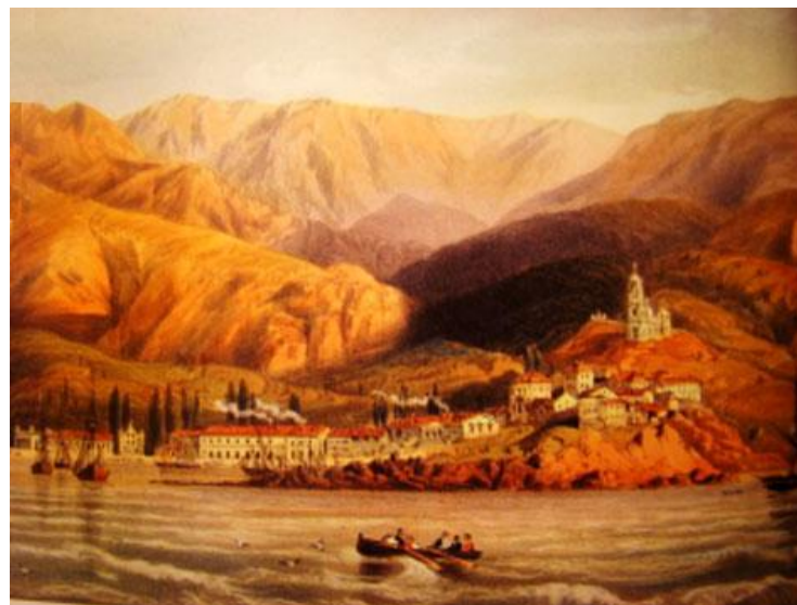
К. Боссоли Ялта