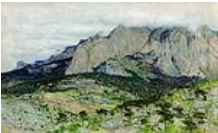
И. Левитан Ай-Петри