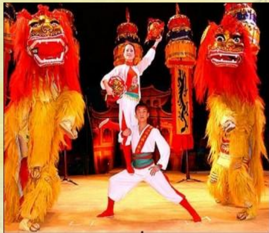
Национальный цирк Китайской Народной Республики