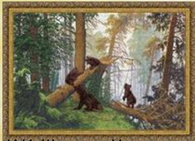
И.И. Шишкин «Утро в сосновом лесу»