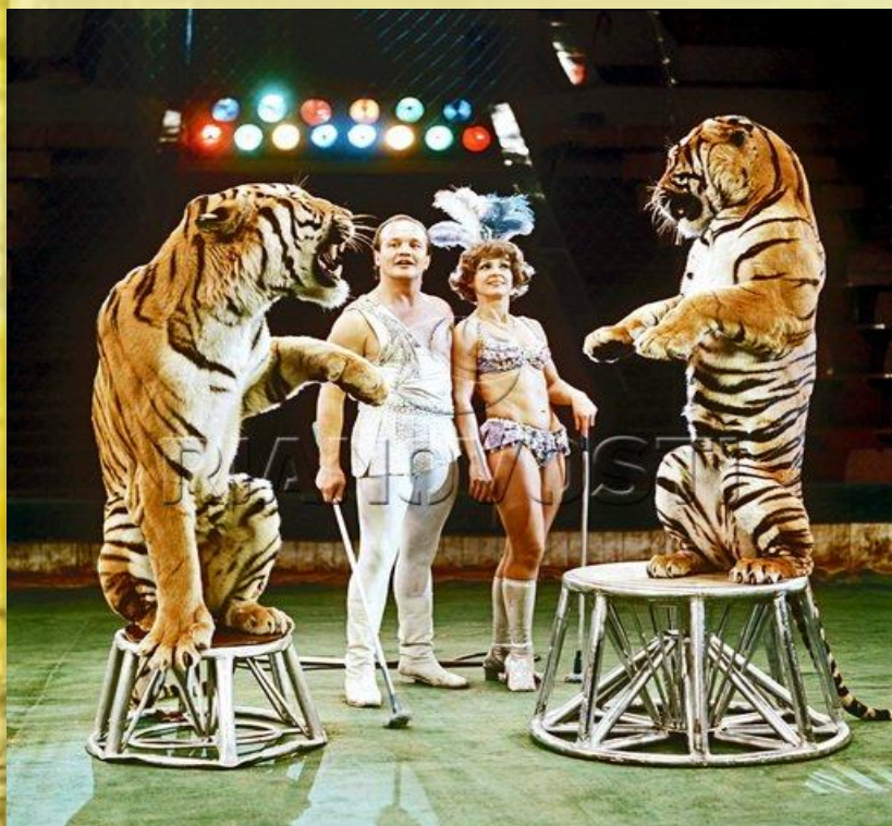
Артисты Большого Московского Государственного цирка

Цирк — искусство акробатики, эквилибристики, гимнастики, пантомимы, жонглирования, фокусов, клоунады, музыкальной эксцентрики, конной езды, дрессировки животных.