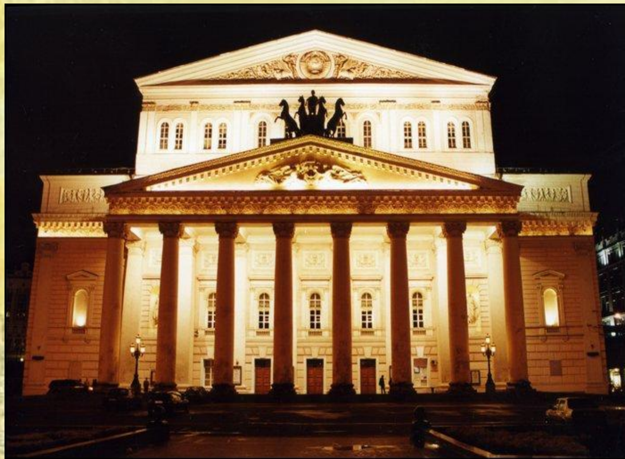
Здание Большого театра. (ГАБТ), Основан в 1776 в Москве

Театр — вид искусства, специфическим средством выражения которого является сценическое действие, возникающее в процессе игры актера перед публикой