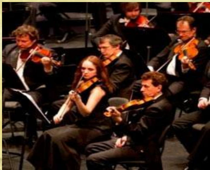
Государственный академический Большой симфонический оркестр им. П.И. Чайковского

МУЗЫКА (греческое musike , буквально - искусство муз), вид искусства, в котором средством воплощения художественных образов служат определенным образом организованные музыкальные звуки. Музыка фиксируется в нотной записи и реализуется в процессе исполнения.