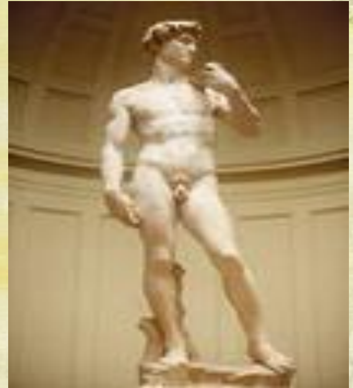
Статуя Давида Микельанджело Б.