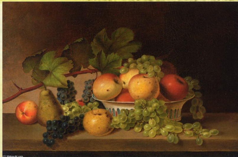
П.П. Рубенс Натюрморт.