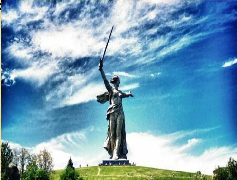
Статуя работы скульптора Вучетича Е.В. «Родина- Мать зовет»

Скульптура - вид изобразительного искусства — создание объемных изображений (статуй, бюстов, барельефов и т. п.) путем лепки, высекания, резания или