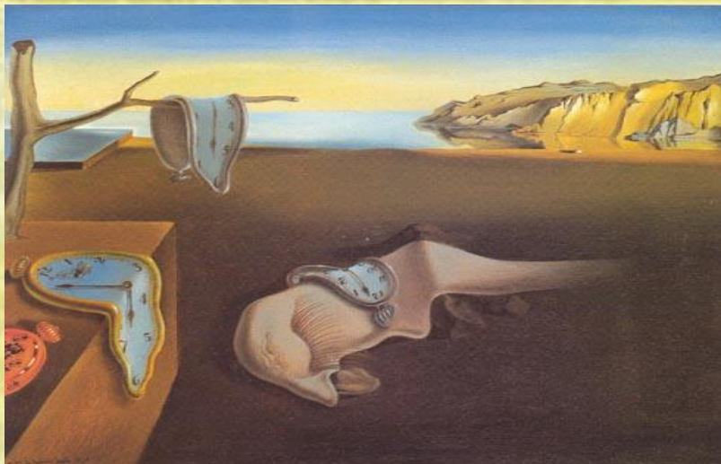
С.Дали «Постоянство памяти»