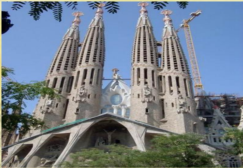
Саграда Фамилия Архитектор А Гауди

Архитектура — искусство проектировать и строить здания и другие сооружения (также их комплексы), создающие материально организованную среду, необходимую людям для их жизни и деятельности, в соответствии с назначением, современными техническими возможностями и эстетическими воззрениями