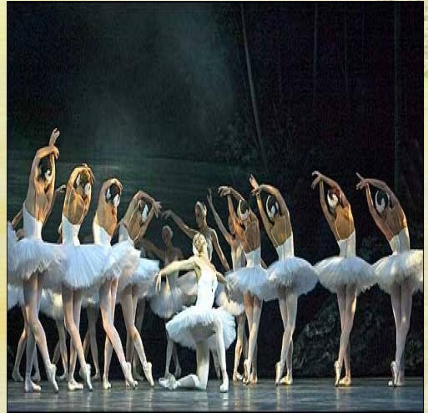
П.И. Чайковский «Лебединое озеро».