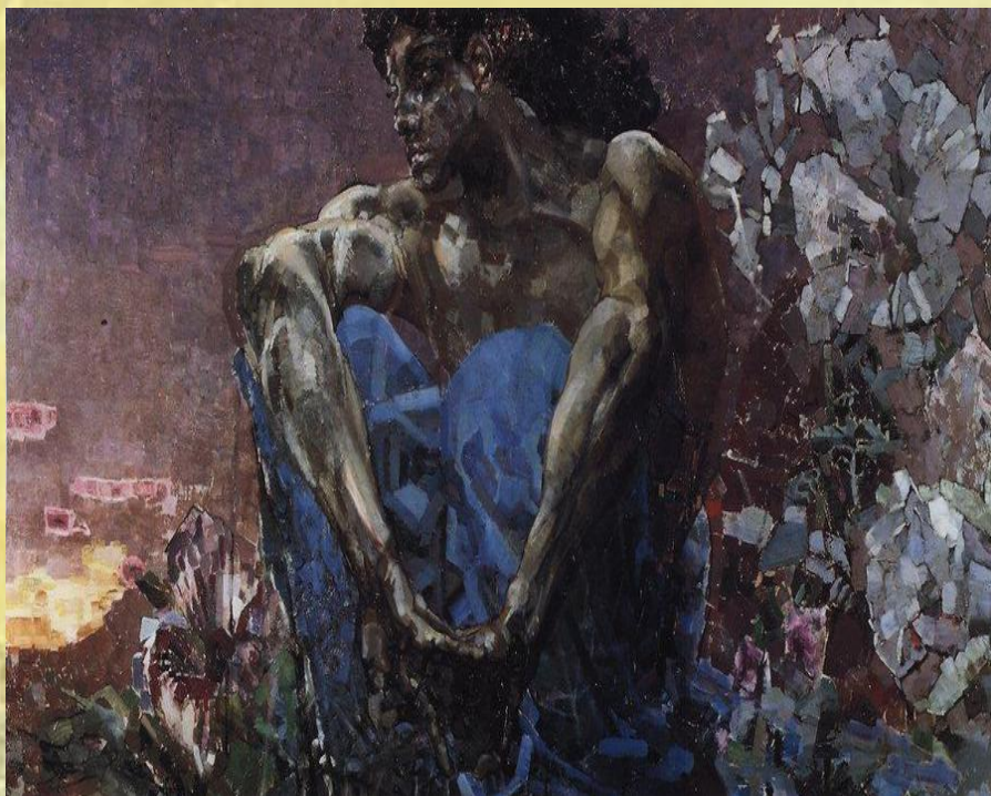
М. Врубель «Демон сидящий»

Живопись - вид изобразительного искусства, художественные произведения, которые создаются с помощью красок, наносимых на какую-либо твёрдую поверхность.