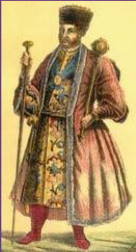
Войсковой атаман с булавой и насекой