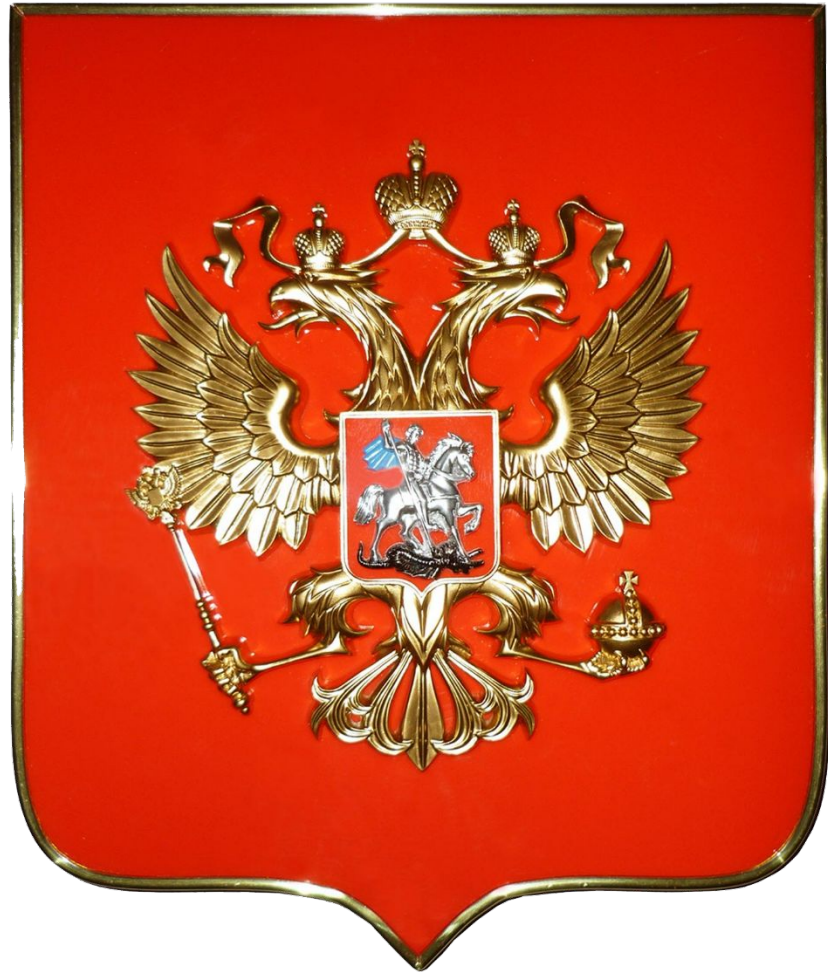
Рисунок современного государственного символа был выполнен питерским художником Евгением Ухналевым .

Щит выступает символом защиты земли . В настоящий момент значение герба РФ трактуется как слияние консерватизма и прогресса.