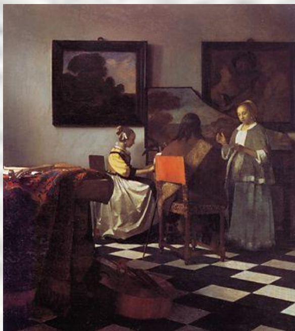
Я.Вермеер «Концерт» 1665 г.