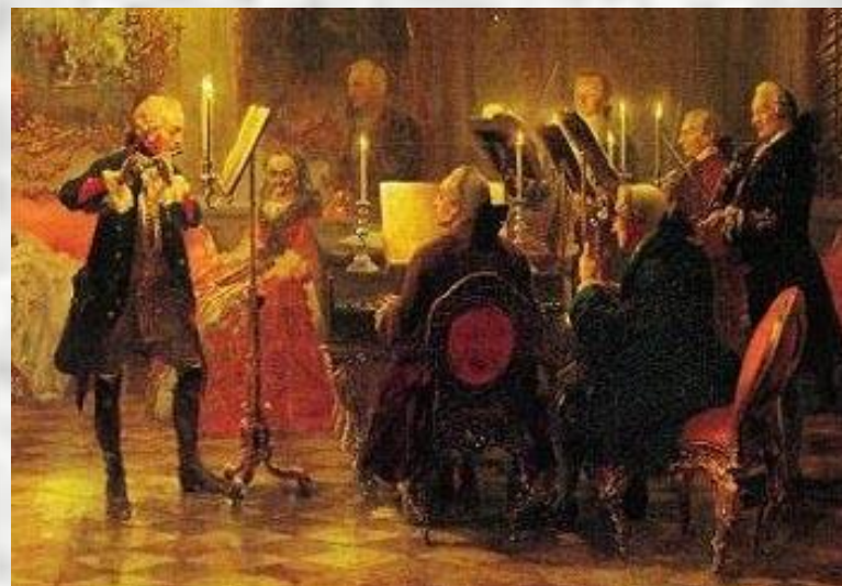
А. Менцель Флейтовый концерт 1852 г.