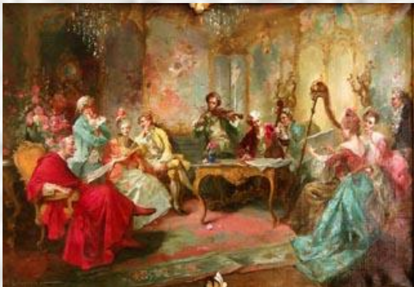
Р. Гинкур «Концерт» 1894 г.