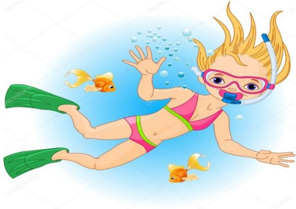
faire de la plongée