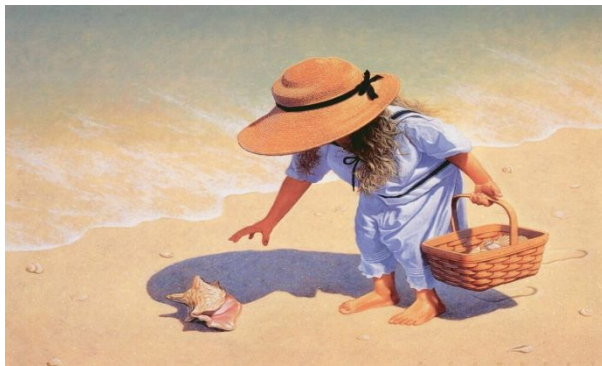
ramasser des coquillages