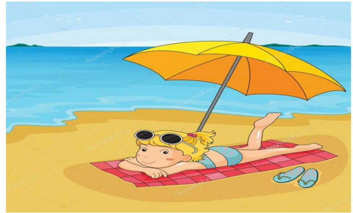
bronser au soleil