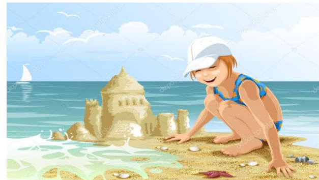
faire des châteaux de sable