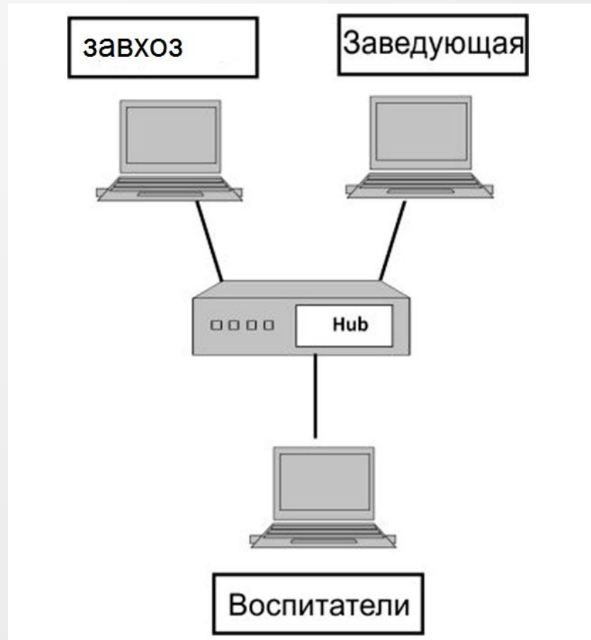
Схема компьютерной сети