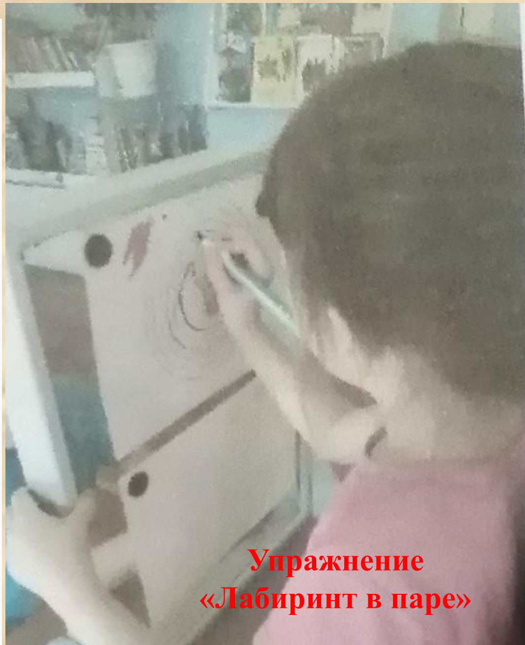
Упражнение «Лабиринт в паре»

Вариант 2. Дети стоят рядом. Один ребенок ведет пальчиком туда, куда говорит ему другой.