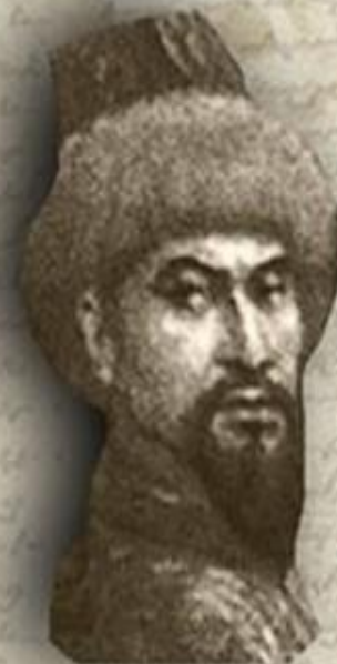
(1626–1718) «ЖЕТИ ЖАРҒЫ» (СЕМЬ ЗАКОНОВ) ТӘУКЕ ХАН