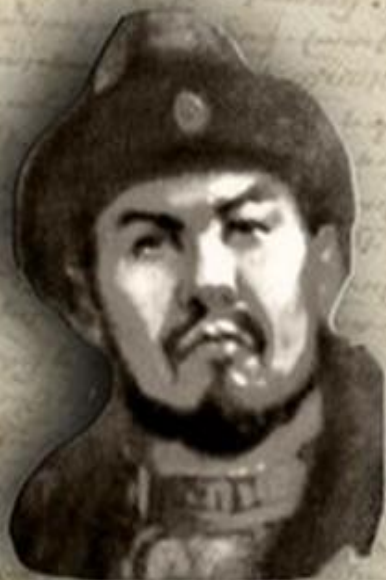
(1445–1518) «ҚАСҚА ЖОЛЫ» (СВЕТЛЫЙ ПУТЬ) ҚАСЫМ ХАН