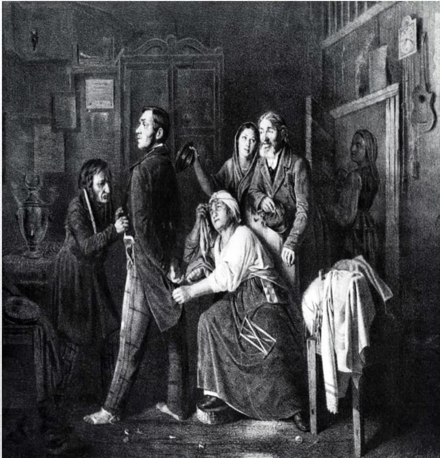
“Сын дьячка, произведенный в первый чин”(1860)