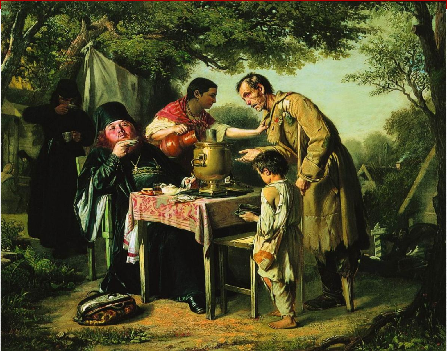
“Чаепитие в Мытищах” (1862)