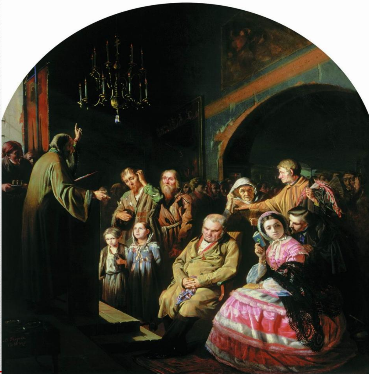
“Проповедь в селе” (1861)