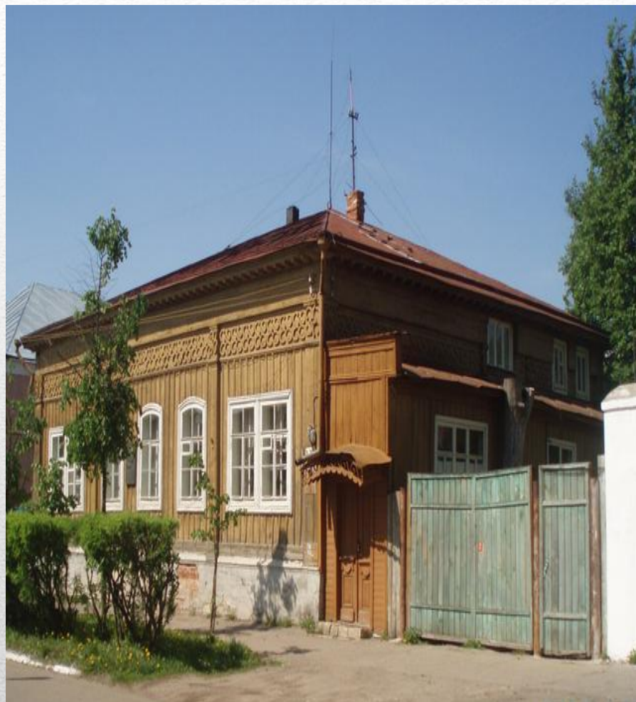
Арзамасское уездное училище