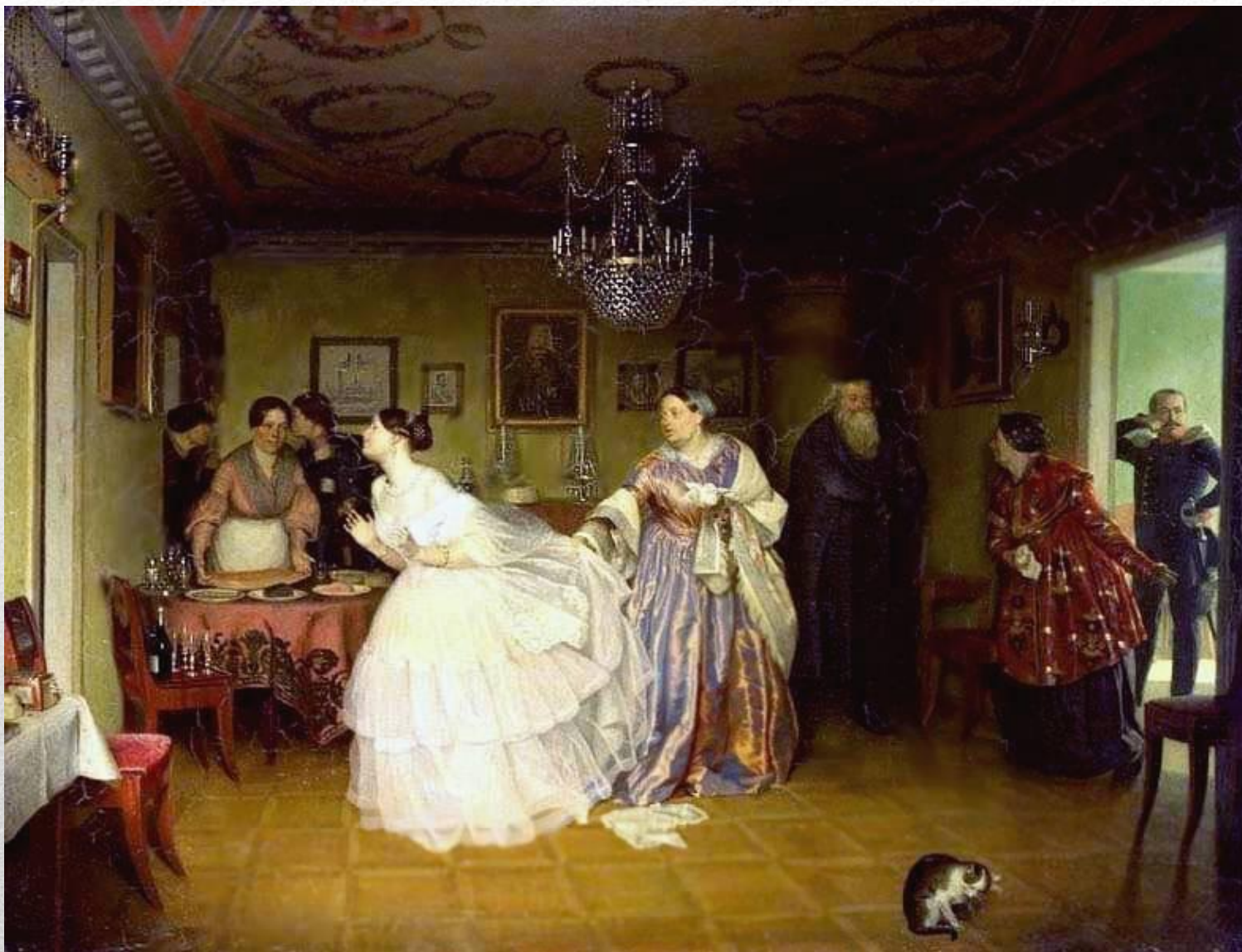
“Сватовство майора” (Федотов)