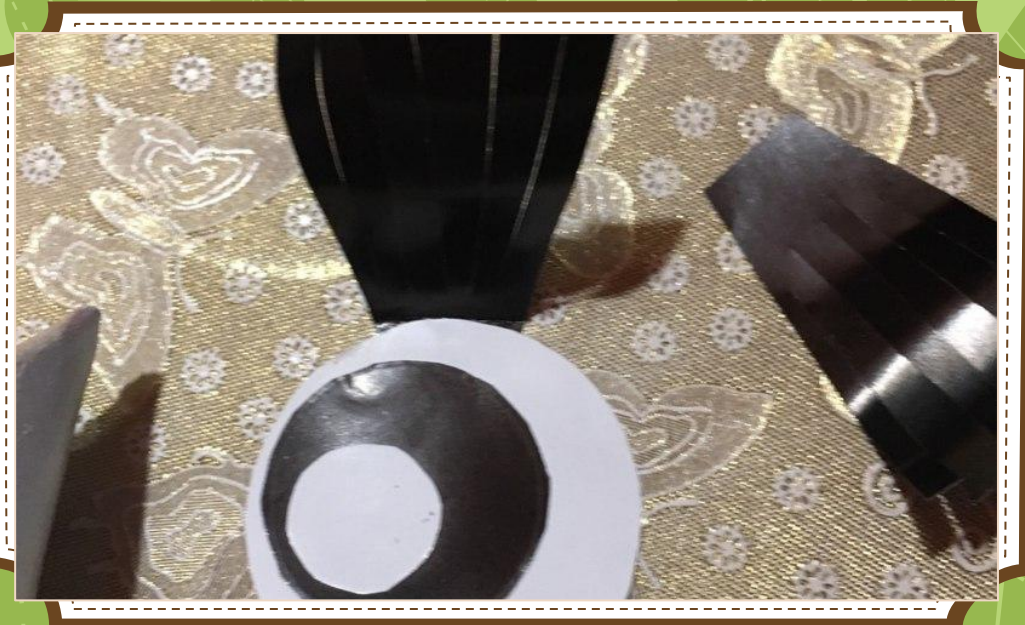
Вырезаем из бумаги глаза.