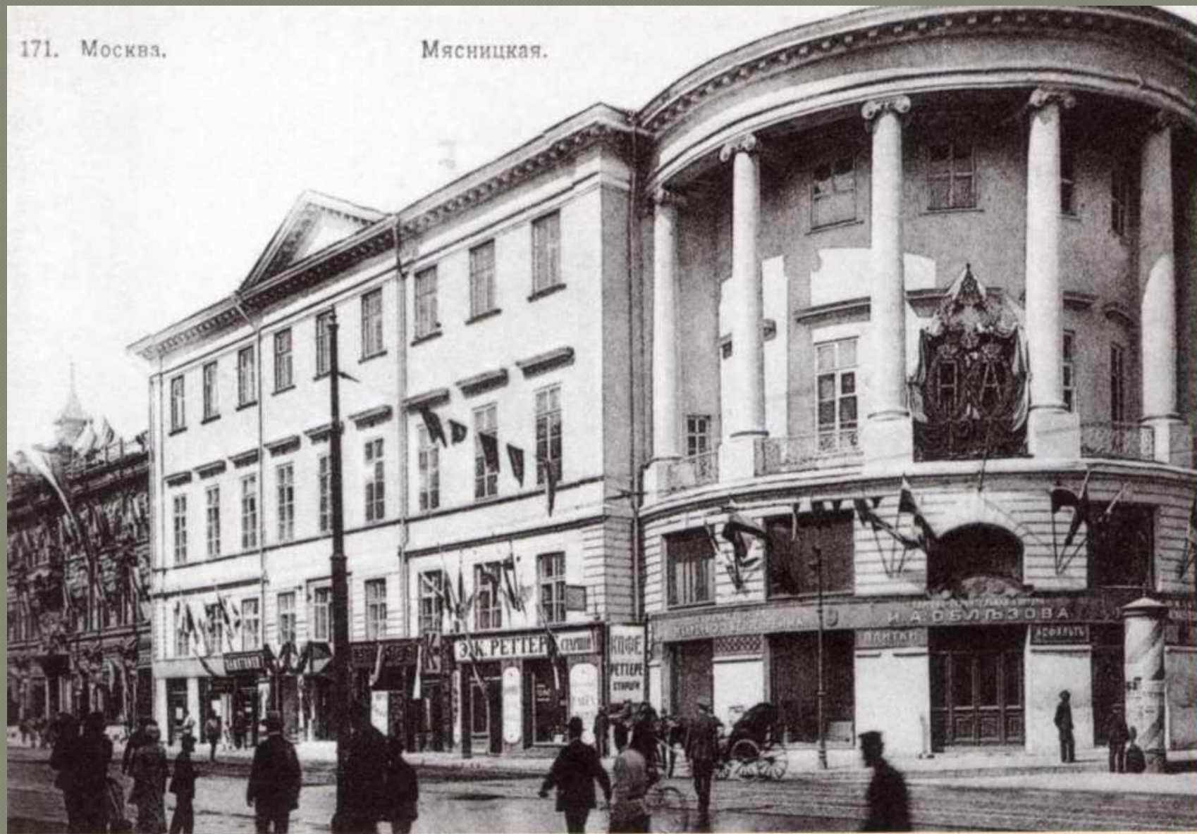
Московское училище живописи, ваяния и зодчества