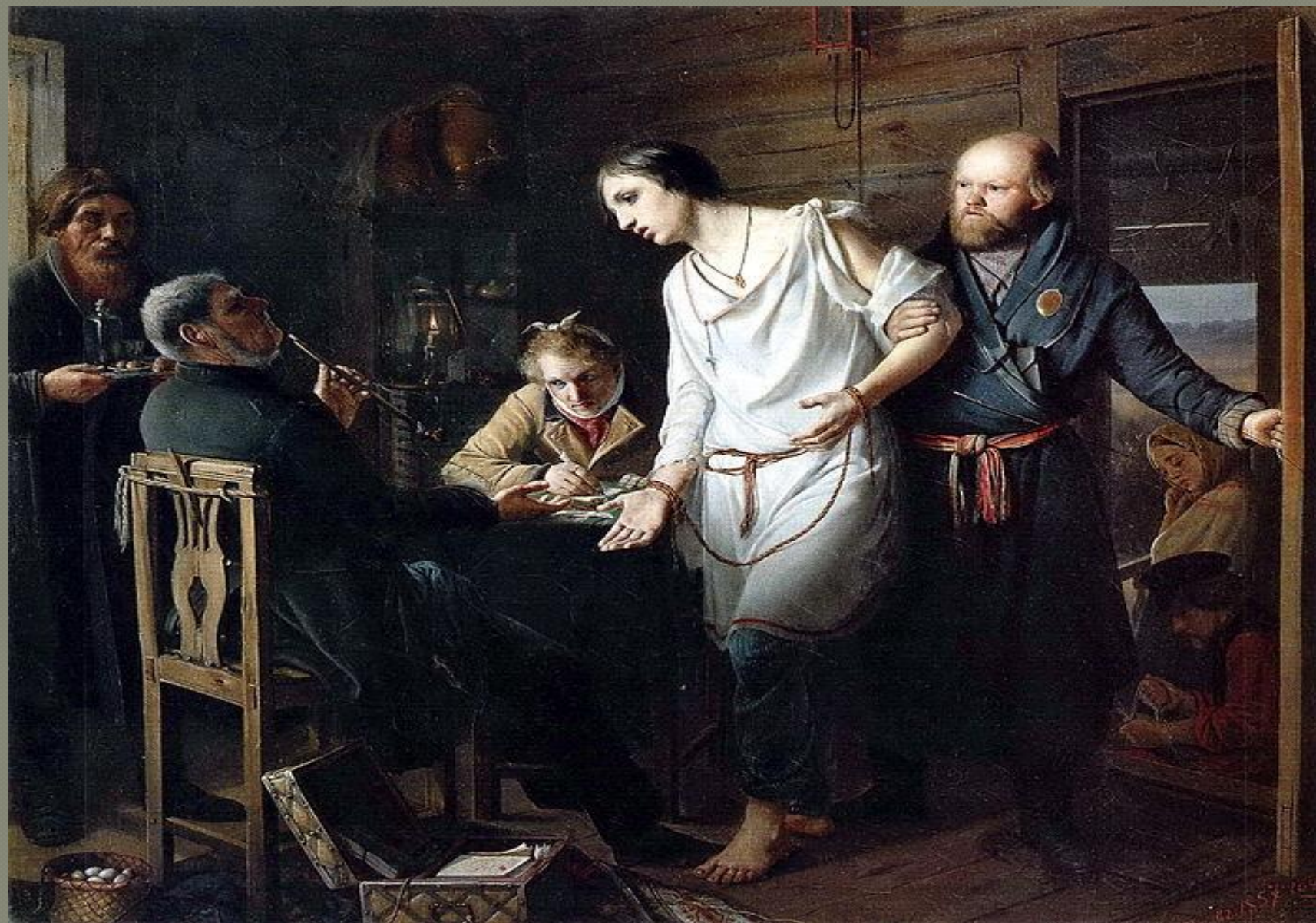
“Приезд станового на следствие” (1858)