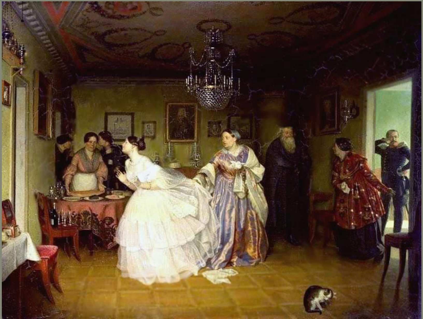
“Сватовство майора” (Федотов)