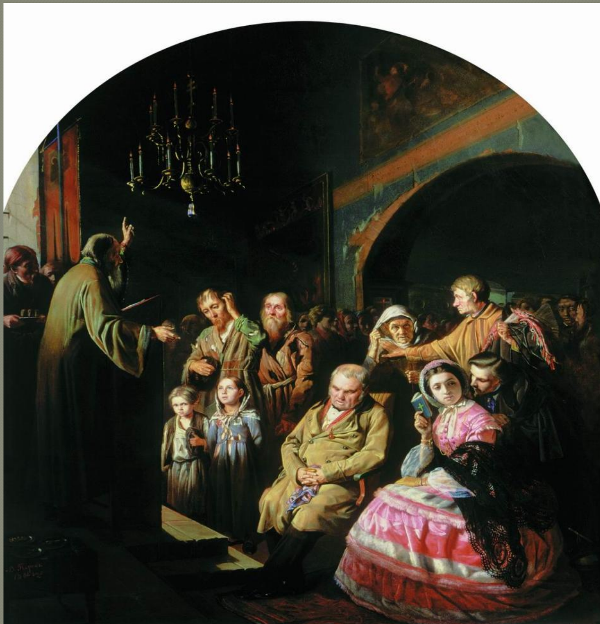
“Проповедь в селе” (1861)