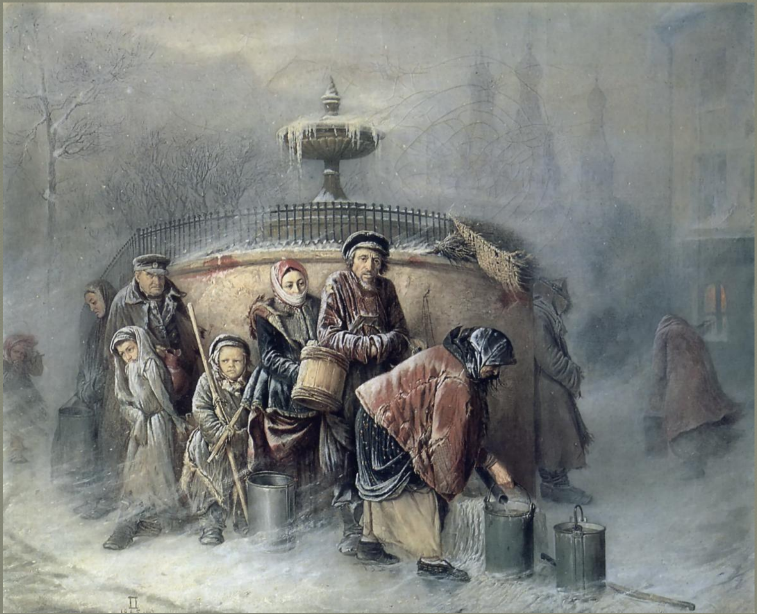
“Очередные у бассейна” (1865)