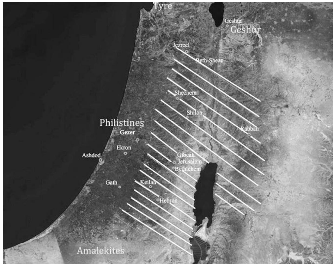
Figure 5.9 Suggested Sphere of Jerusalem's Authority in Early 10th Century BCE