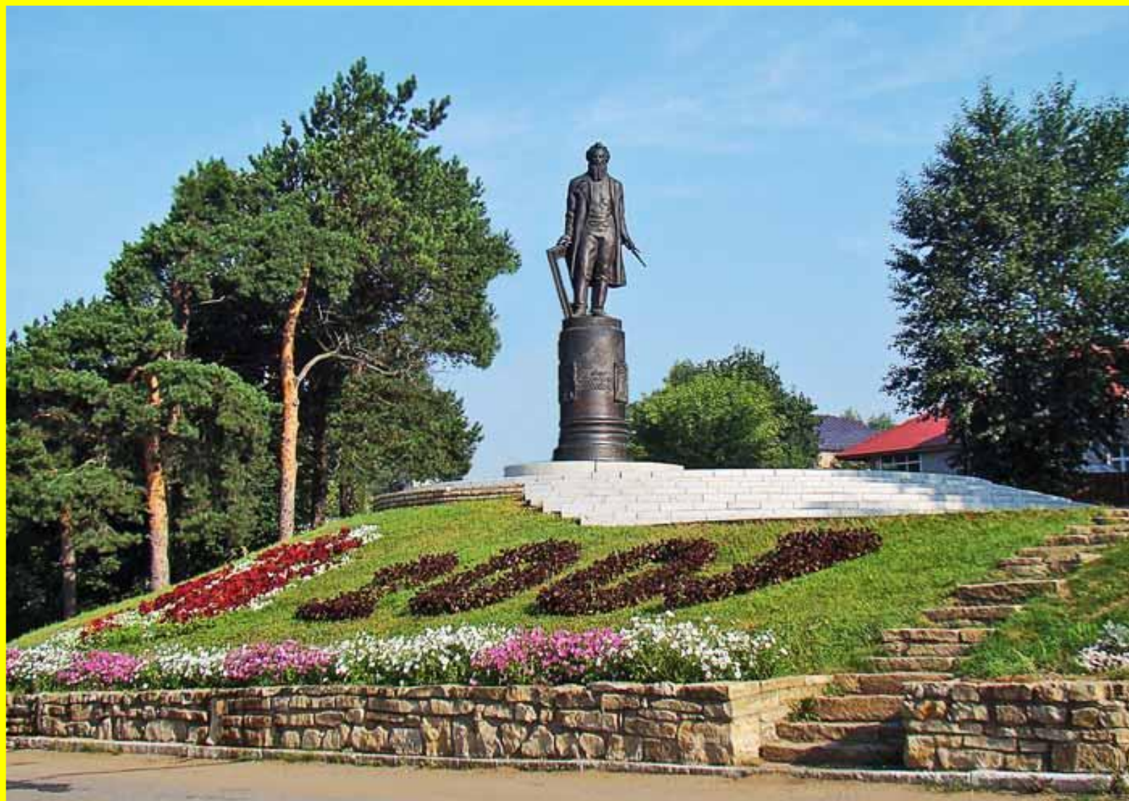
Памятник И.И. Шишкину. Г. Елабуга