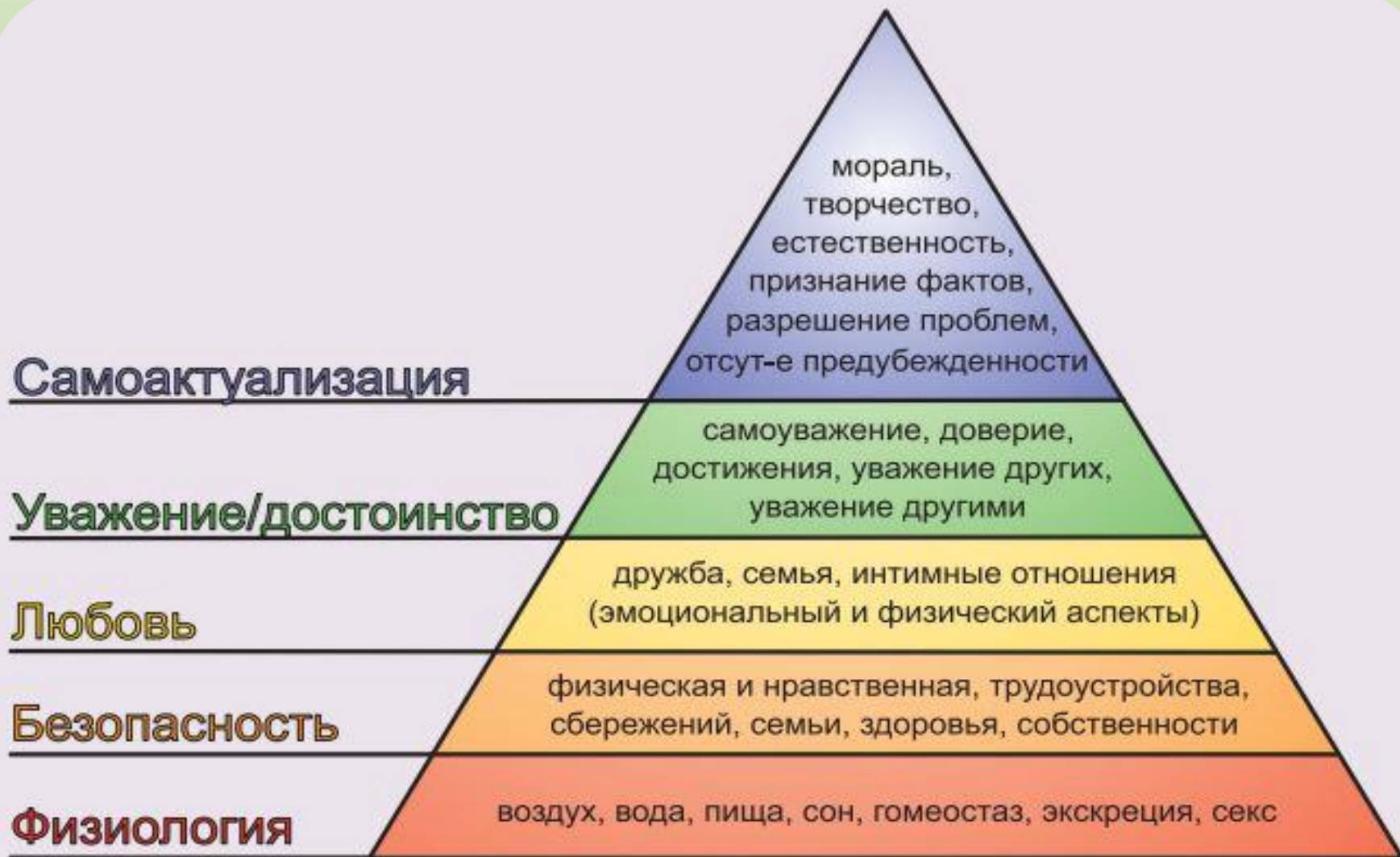
Концепция А. Маслоу иерархии потребностей в мотивации человека