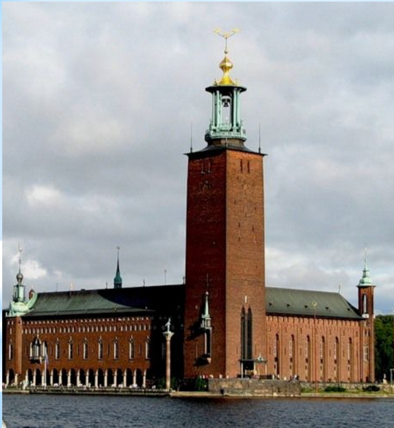
Ратуша в Стокгольме 1911-1923, Р. Эстберг)