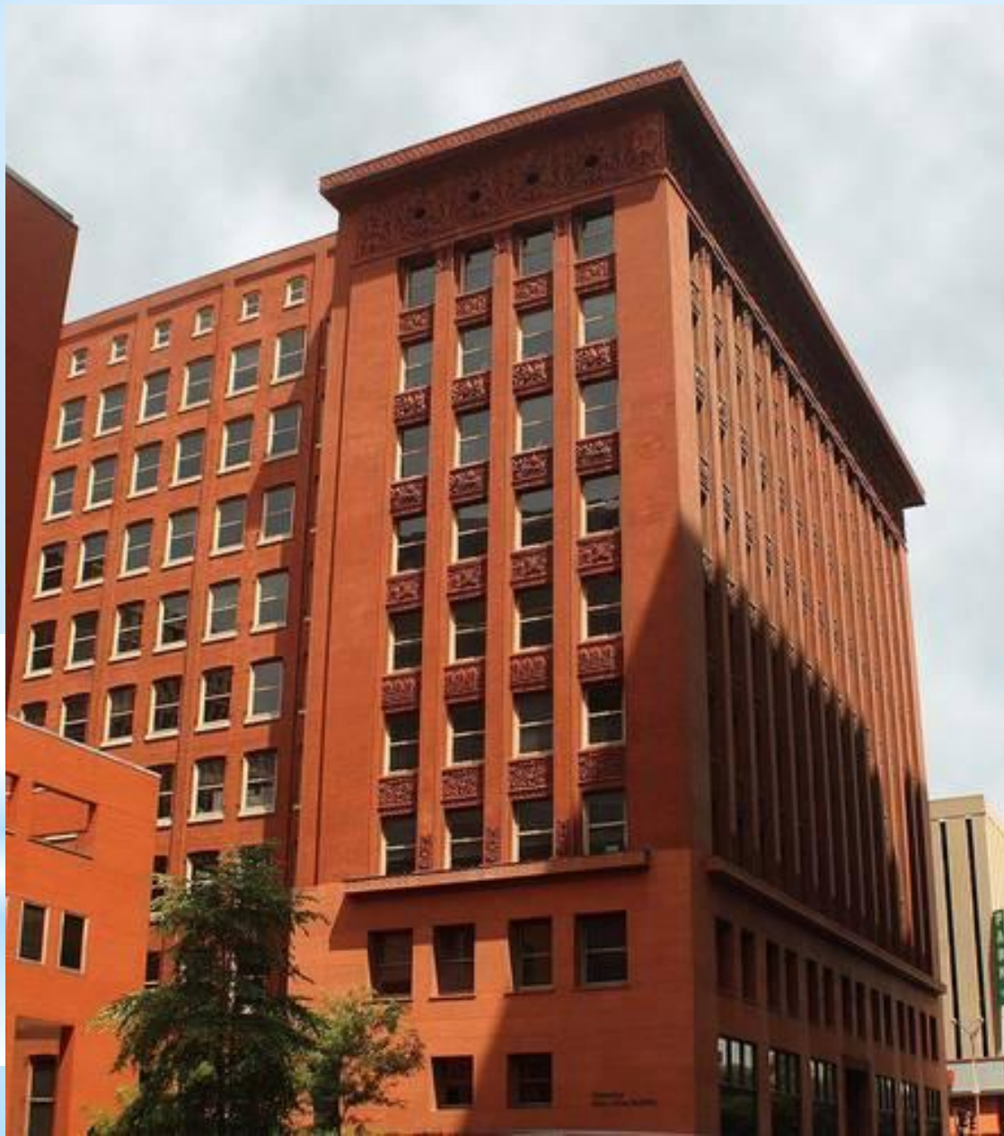
Здание Уэнрайт- билдинг в Сент-Луисе