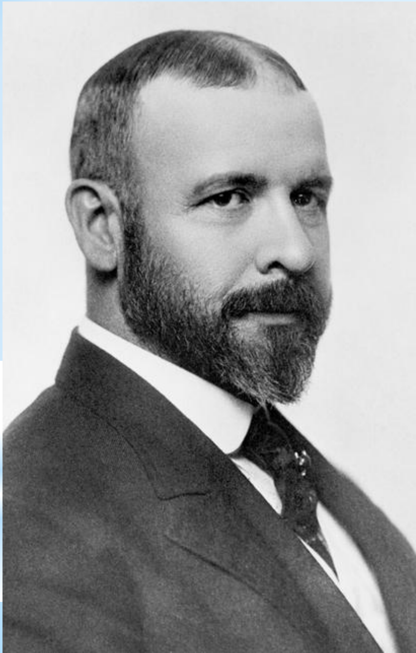
Луис Генри Салливен