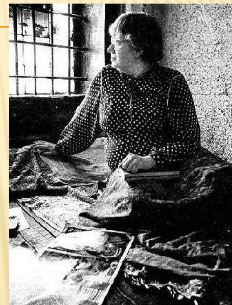
В.Новодворская в тюрьме

(лат. dissidens — «несогласный») — граждане СССР, открыто выражавшие свои политические взгляды, которые существенно отличались от господствовавшей в обществе и государстве коммунистической идеологии и практики, за что многие из диссидентов подвергались преследованиям со стороны властей.