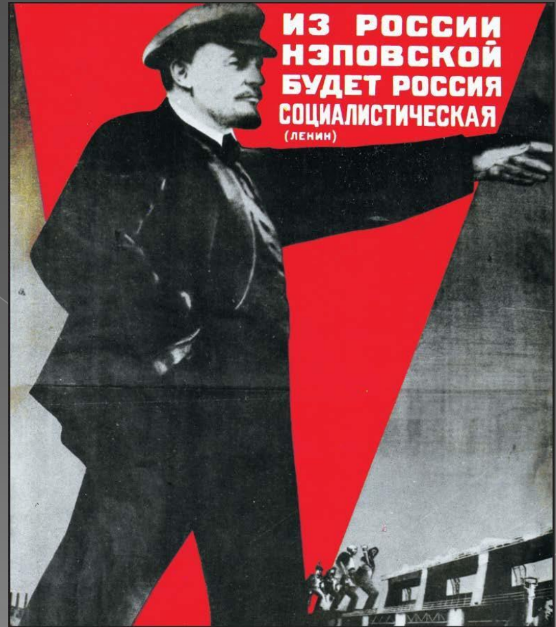
Плакат «Из России нэповской будет Россия социалистическая (Ленин)». Художник Г.Г. Клуцис. 1930 г.