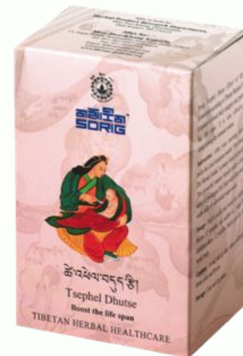
Содержит / Картонная коробка с 30 пакетиками

Исключительные права принадлежат компании ООО "КАРУНА"