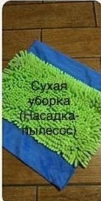
Сухая уборка (Насадка- пылесос)