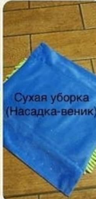
Сухая уборка (Насадка-веник)

Для наиболее качественной уборки можно наливать в ведро самую горячую воду без страха обжечься или испортить праздничный маникюр. Вы легко выполощите всю грязь из насадки и отождмете «косички» практически досуха, что важно для деликатных поверхностей и максимальной эффективности микроволокна. Вращается центрифуга на скорости до 2500 оборотов в минуту — швабра будет готова к работе за считанные секунды. Поражающие своей гигроскопичностью насадки моментально соберут воду вместе с загрязнениями и до блеска ототрут любые поверхности без помощи бытовой химии