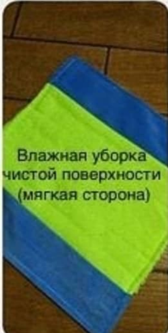
Влажная уборка чистой поверхности (мягкая сторона)