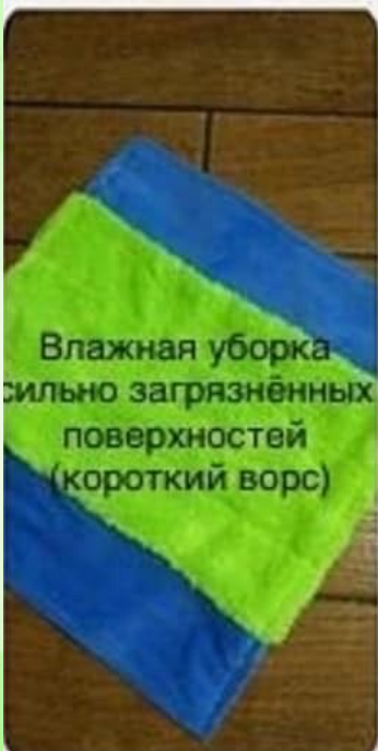
Влажная уборка сильно загрязнённых поверхностей (короткий ворс)