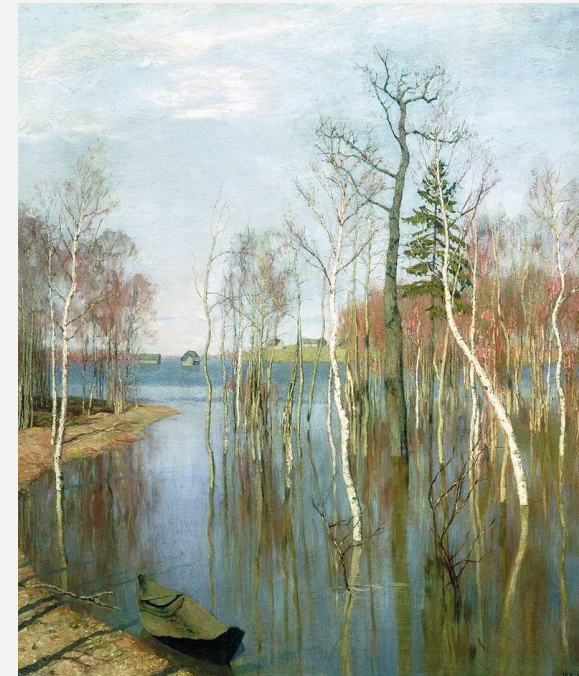
Исаак Левитан . «Весна. Большая вода». 1897