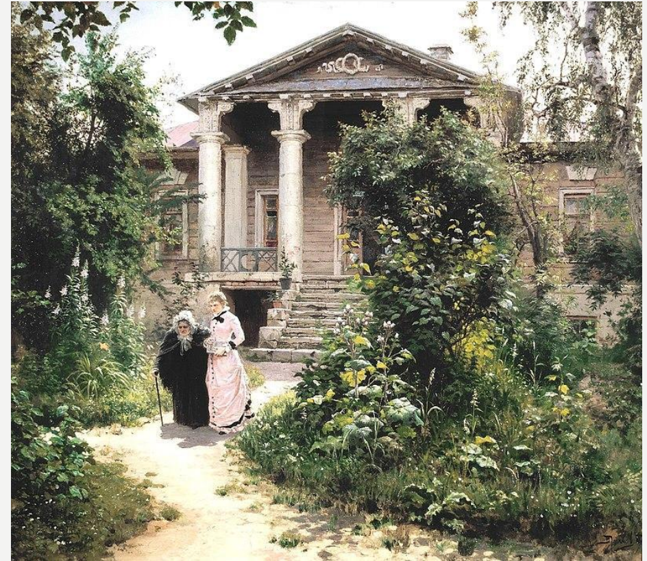
Василий Поленов . « Бабушкин сад ». 1878