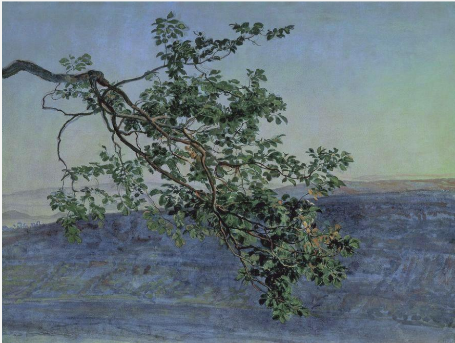
Александр Ива́нов . «Ветка». Эту́д к карти́не «Явление Христа народу». 1840—1850