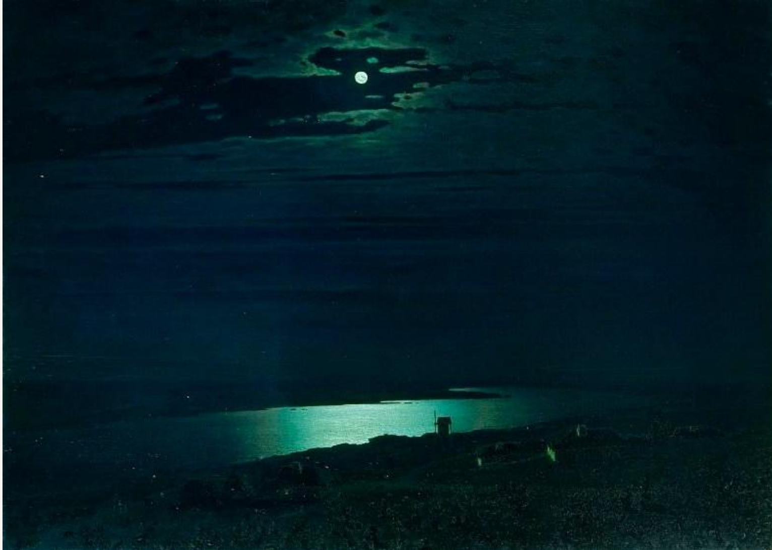
Архип Куинджи. Лунная ночь на Днепре. 105 x 144 см. 1880 г.