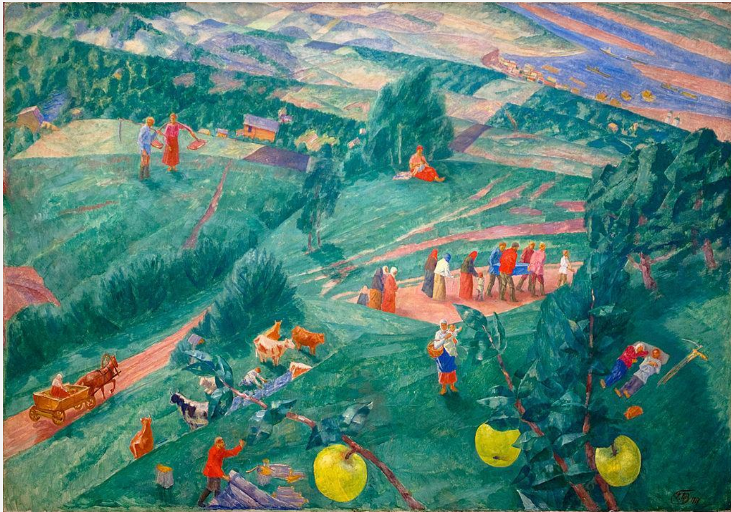
Кузьма Петров-Водкин . «Полдень». 1917