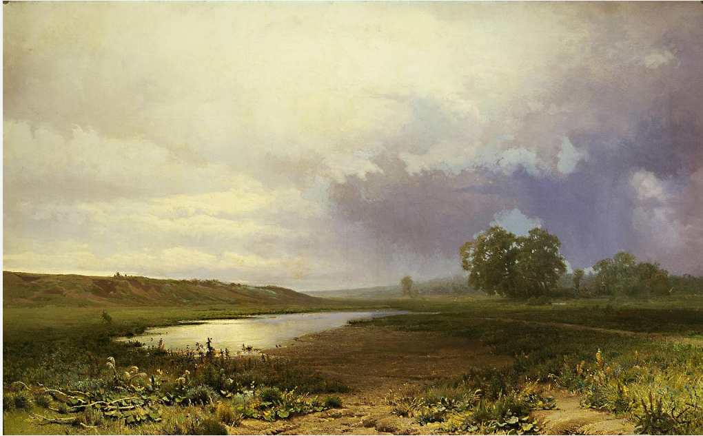
Фёдор Васильев . « Мокрый луг ». 1872