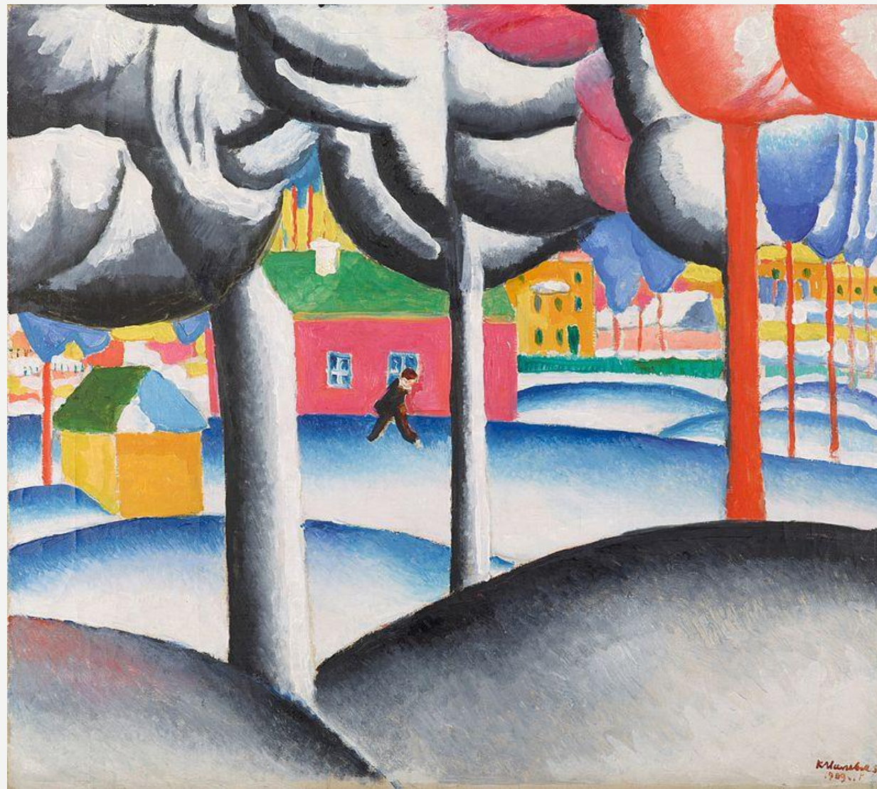
Казимир Малевич . «Пейзаж. Зима». 1909