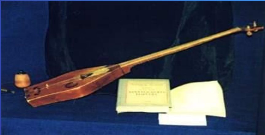
Қаныш Сәтпаев мұражайы