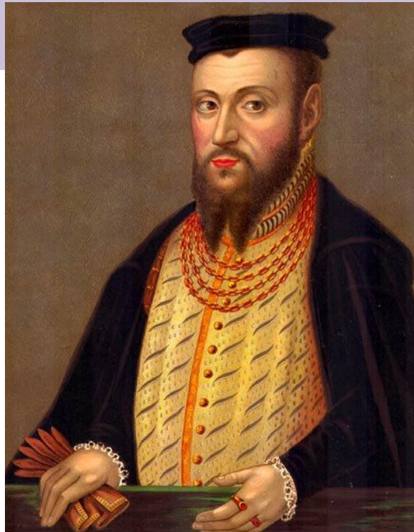
Жыгімонт II Аўгуст