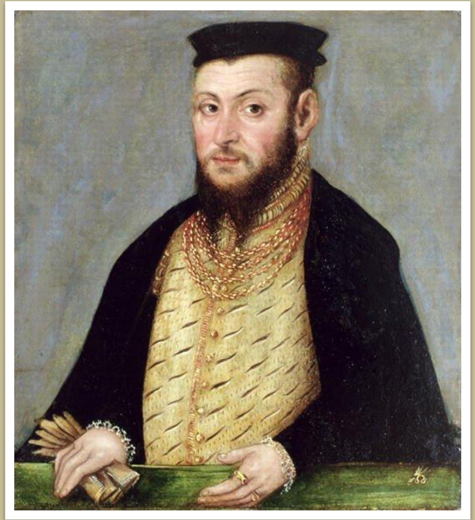
Жыгімонт II Аўгуст

Жыгімонт I, таму што перадаў трон свайму сыну таксама Жыгімонту яшчэ пры жыцці, калі яму было 10 гадоў