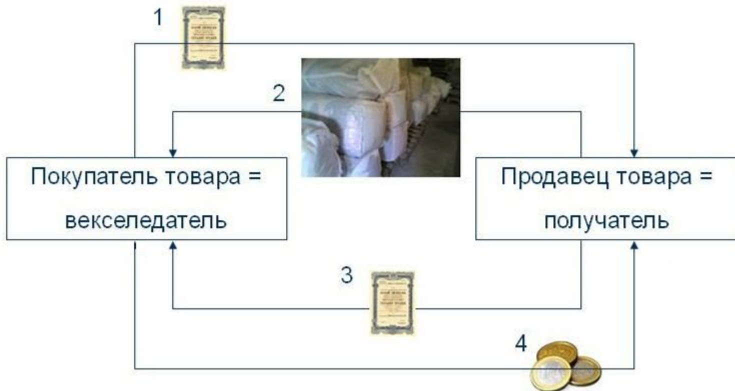
Схема обращения простого векселя