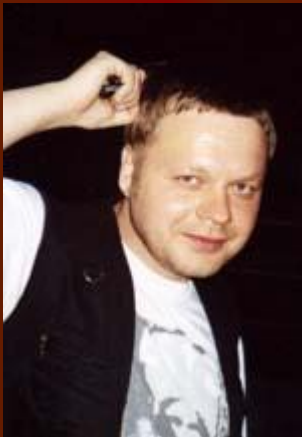
(Вадим Степанцов «Металлистка»)

На металлической тусовке, Где были дансинг и буфет, Ты мне явилась в буйном соке Своих одиннадцати лет.