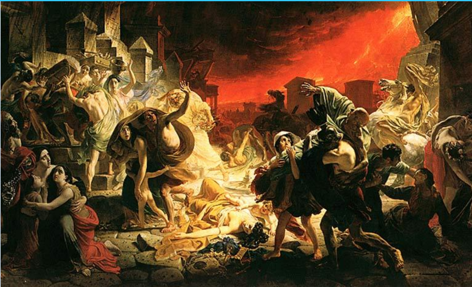
Брюллов. Последний день Помпей

В 18 веке возрастает общественная роль исторической живописи, ее воспитательное и политическое значение.