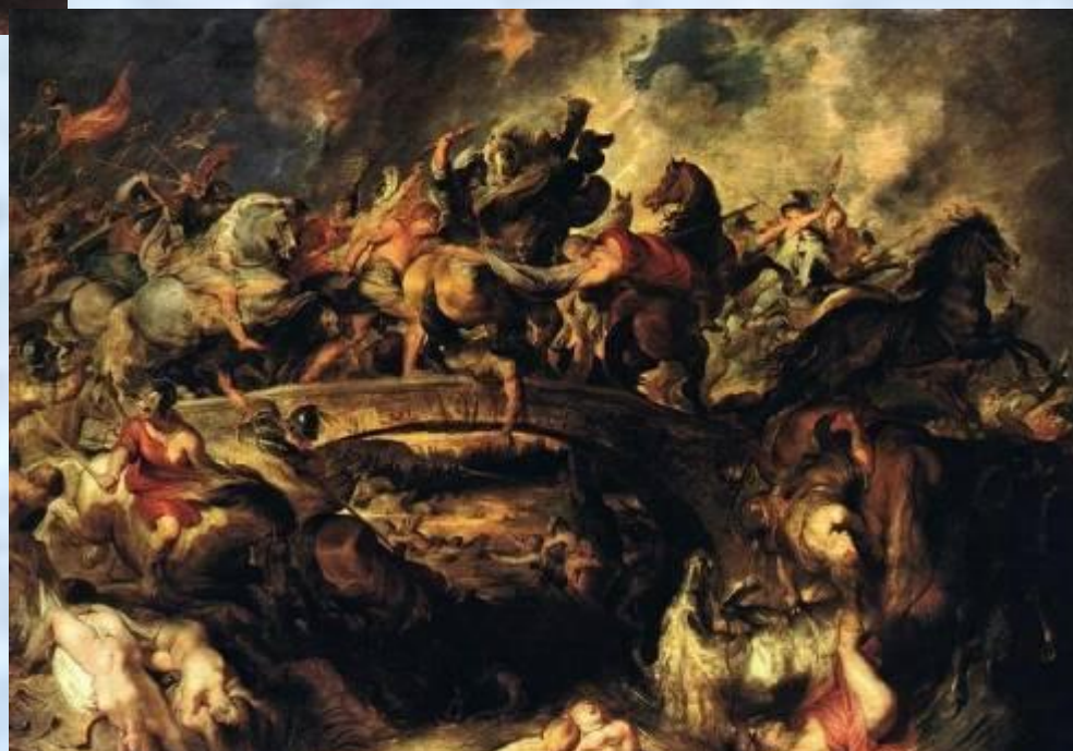
Рубенс. Битва греков с амазонками

Новое рождение исторического жанра произошло в эпоху Возрождения.