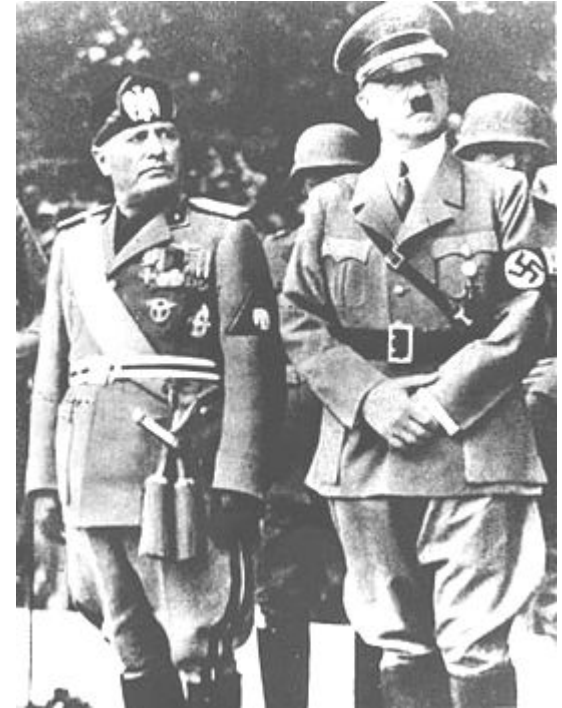
Муссолини и Гитлер