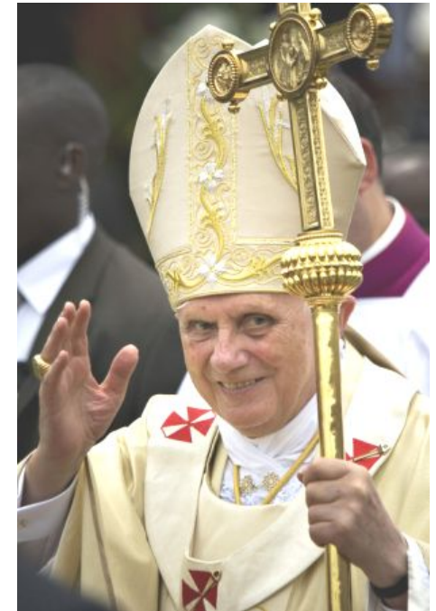
Папа Римский Бенедикт XVI