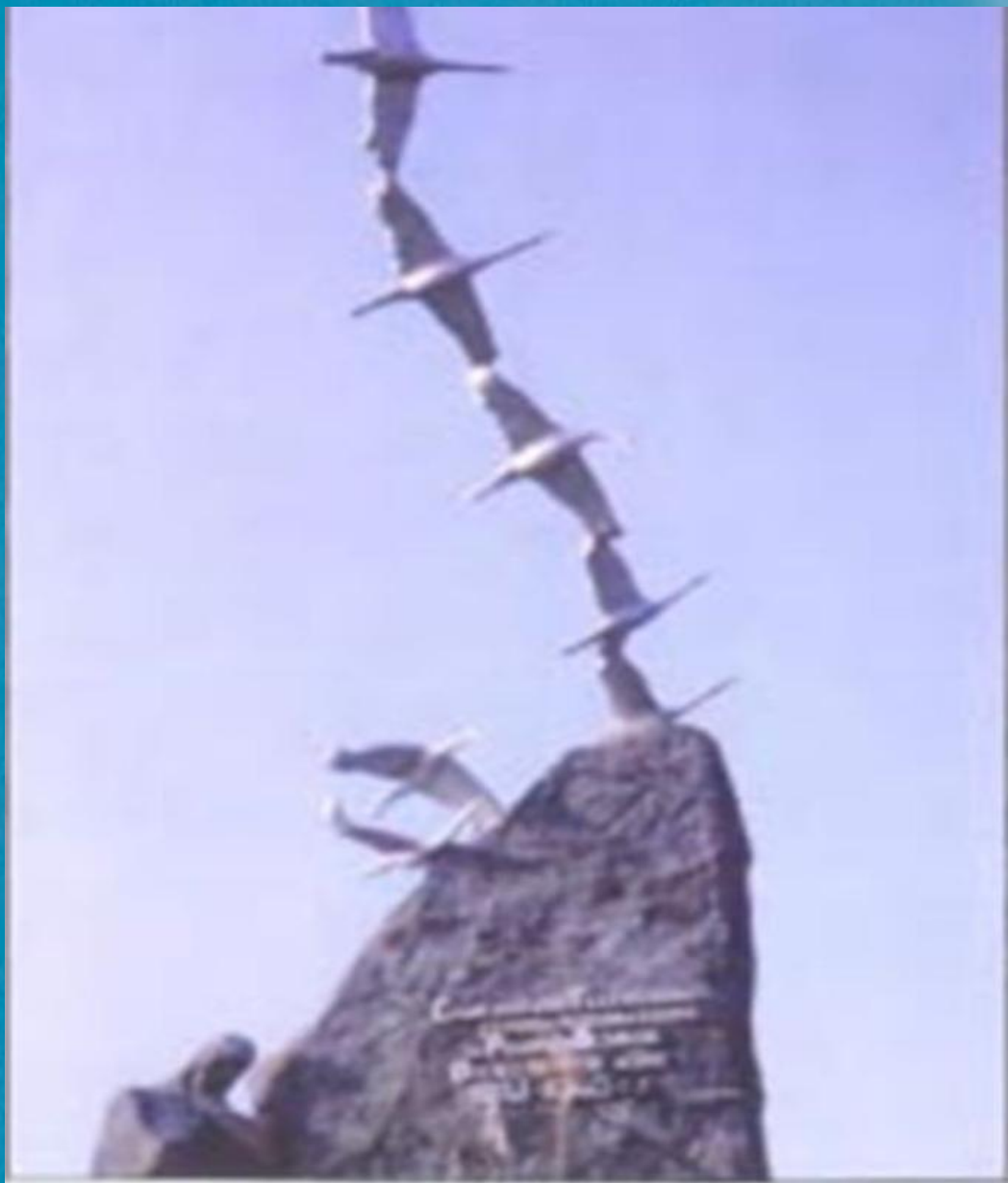
с. Дзуарикау, Северная Осетия