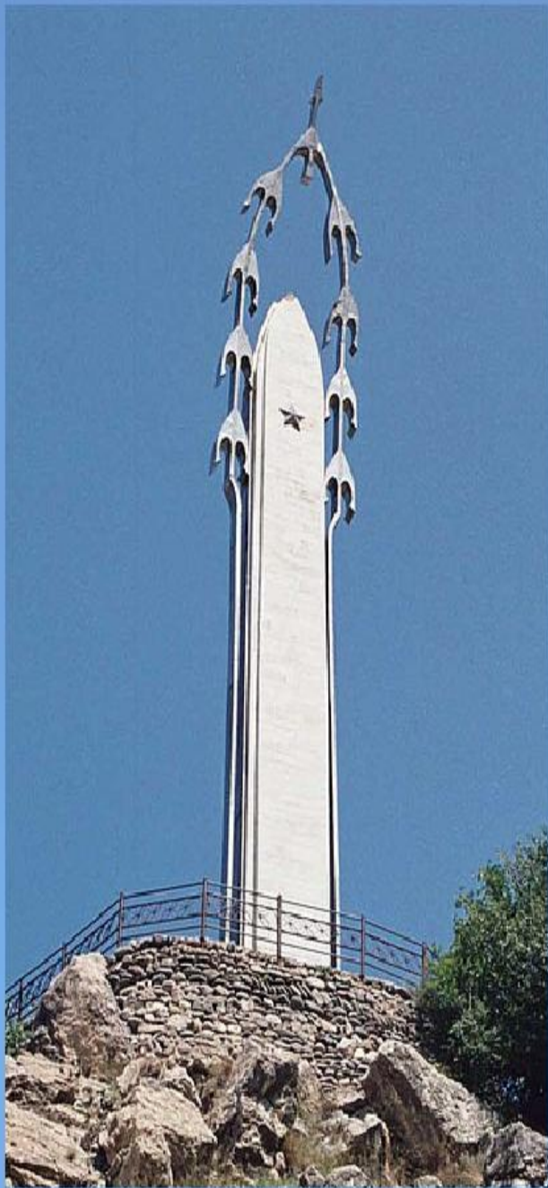
Памятник «Белым журавлям» в Дагестане в селении Гуниб открыт 6 августа 1986 года