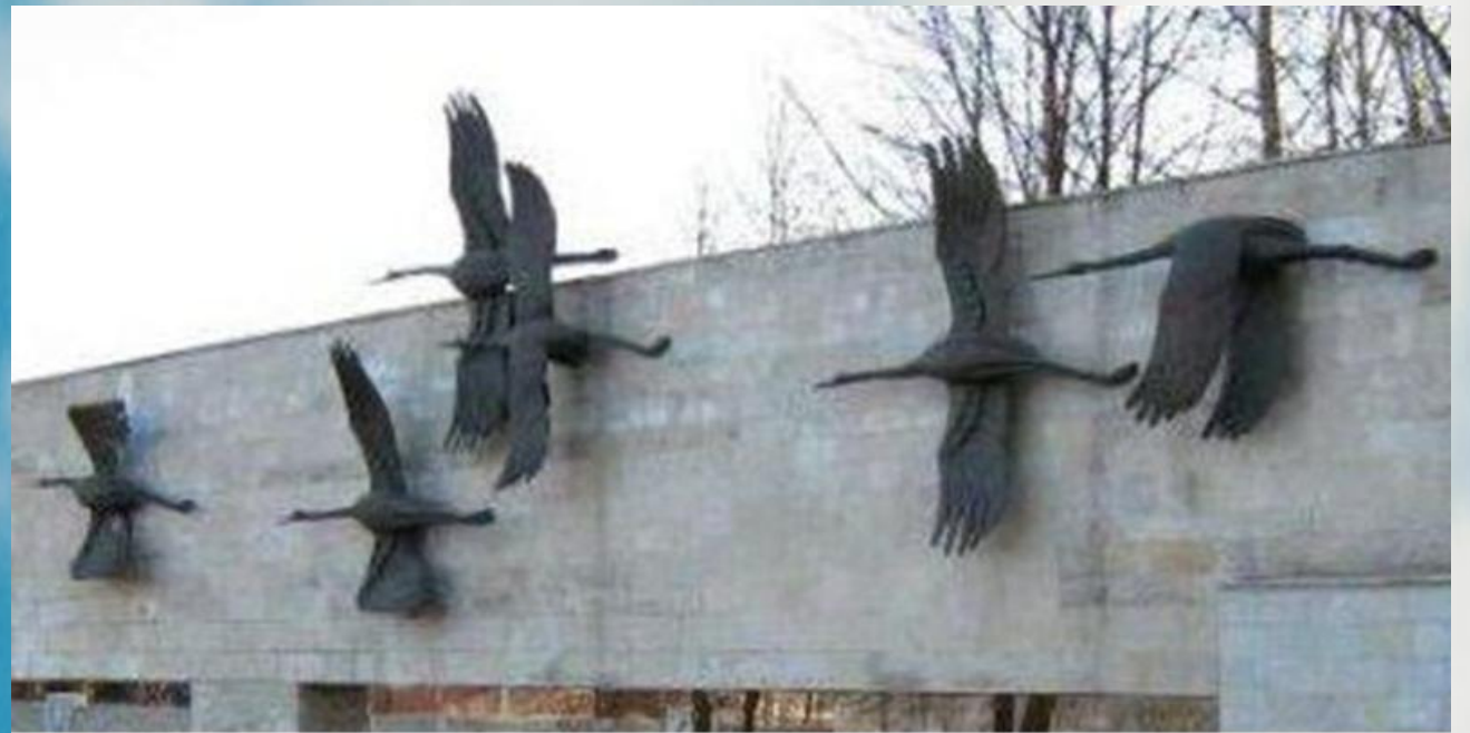
В 1980 году открыт мемориал в Санкт-Петербурге под названием «Журавли».