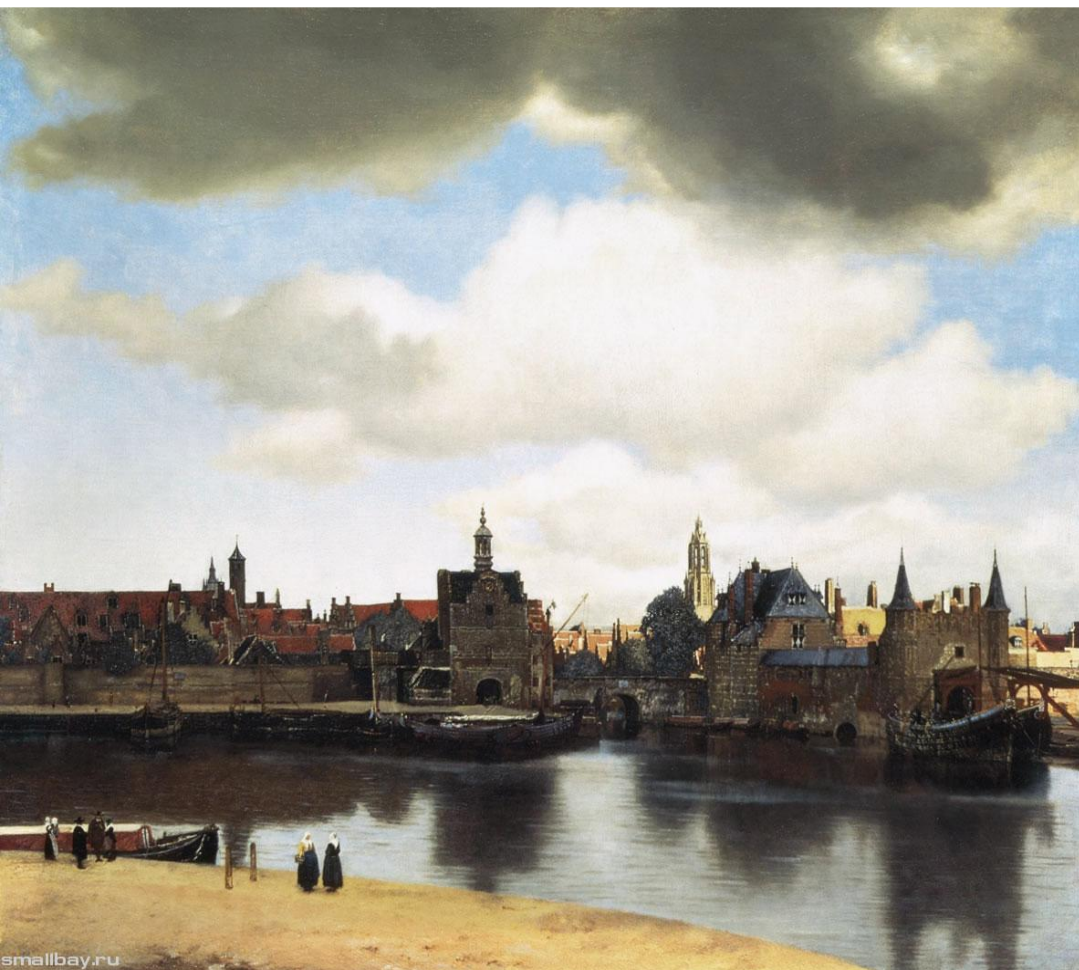
«Вид города Делфта»

Голландский живописец Ян Вермеер впервые стал писать картины с натуры, что стало новшеством голландской живописи XVII века.