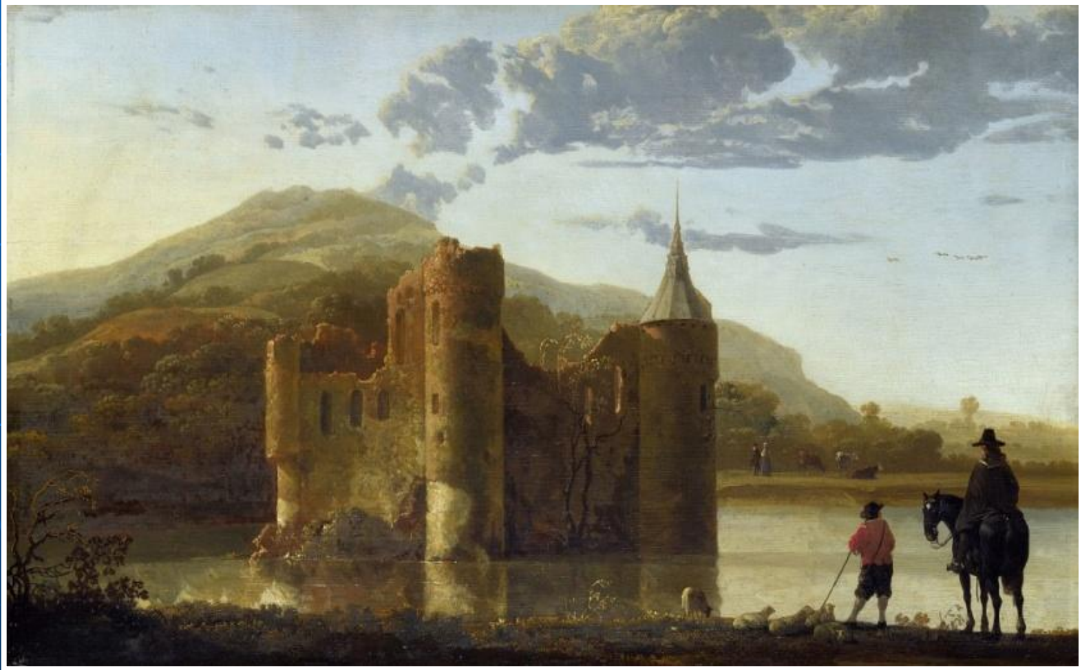
«Пейзаж с замком Берген» Алберт Якопс Кейб

Город – это не мир природы, виды города принято называть городским пейзажем. Впервые достоверное изображение города появилось в период готики.