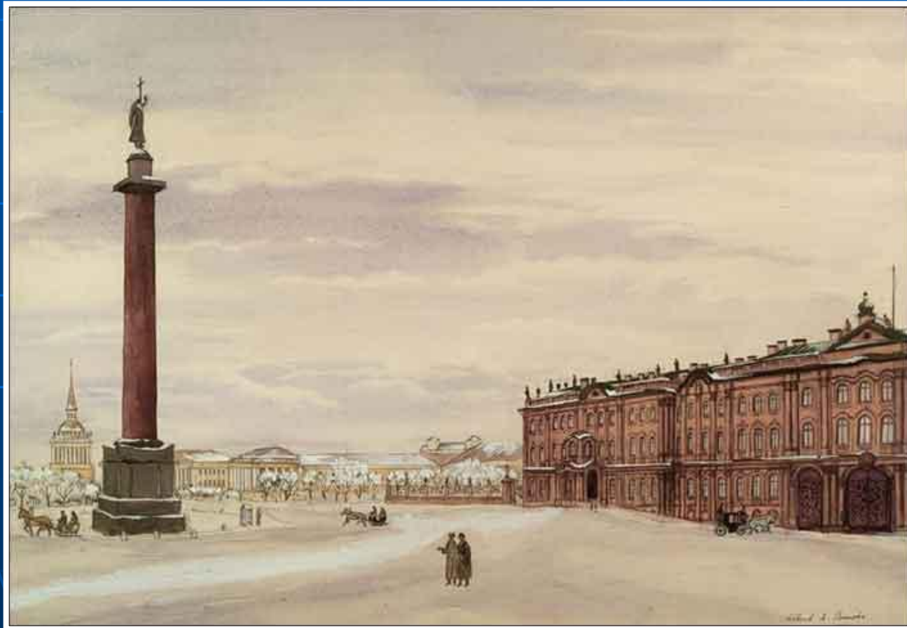
«Дворцовая площадь» Александр Бенуа

Совершенно новое значение образ города приобрел в творчестве художников, создавших объединение вокруг журнала «Мир искусства». Город здесь обрел таинственную одушевленность, изменчивость настроений.