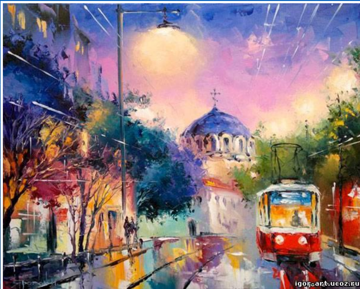
«Вечерняя Евпатория» Игорь Яровой

Городской пейзаж сегодня привлекает внимание очень многих художников, ведь большинство людей живет в городах.