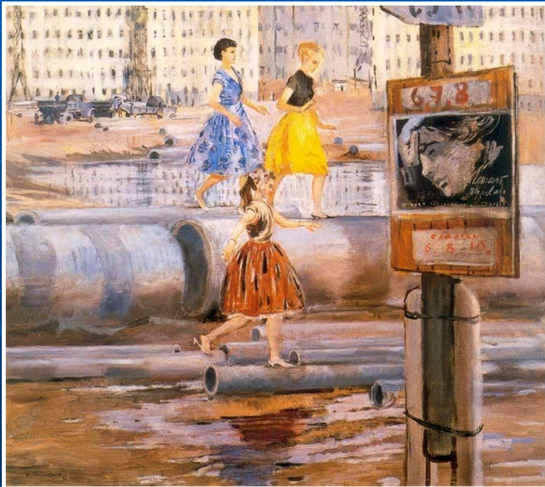
«Первые модницы нового квартала»

Главный предмет наблюдения и поэтизации - оказавшие Москву новые кварталы. Он любуется самой их неоконченностью и необжитостью, временным, еще не устроенным бытом.