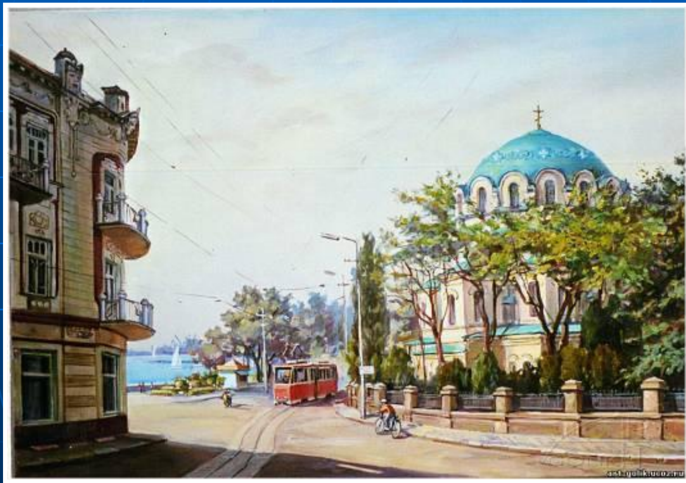
«Переулки старого города» Павел Голик

Художников всегда привлекает разнообразие этих форм и конструкций. Увлекателен и сам быт этих улиц, наполненных непрерывным движением.