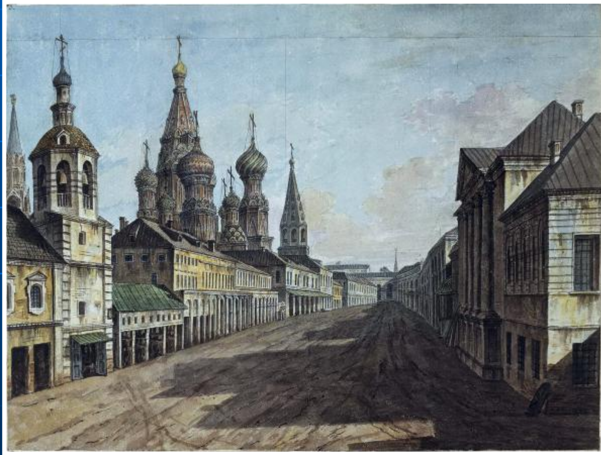
«Вид храма Василия Блаженного от Москворецкой улицы»

В русском искусстве одним из первых мастеров городского пейзажа был Федор Яковлевич Алексеев, в 1800 году получивший задание императора Павла I запечатлеть виды Москвы. Он оставил нам яркий образ Москвы ещё до пожара 1812 г.