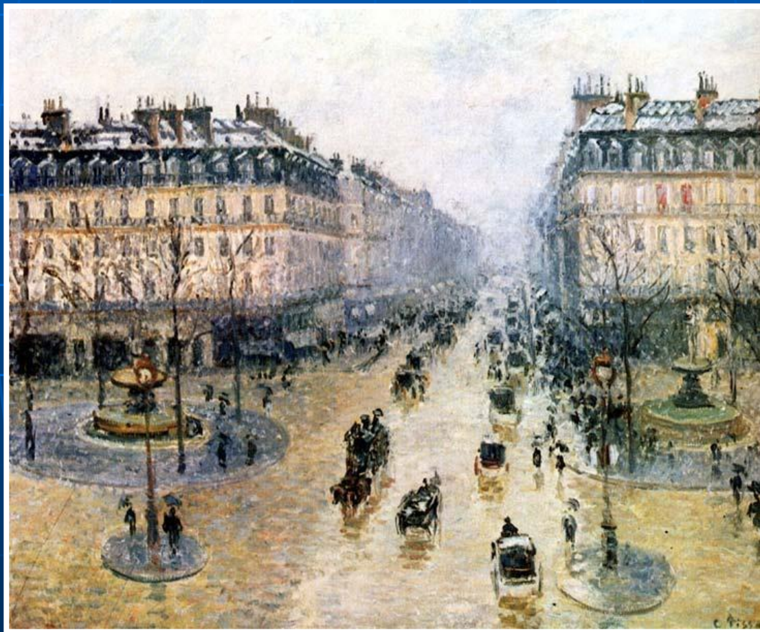
«Оперный проезд в Париже»

В XIX веке городской пейзаж находит своё отражение в творчестве французского художника-импрессиониста Камиля Писсарро, который в своих картинах изображал текучесть жизни и переменчивость большого города.