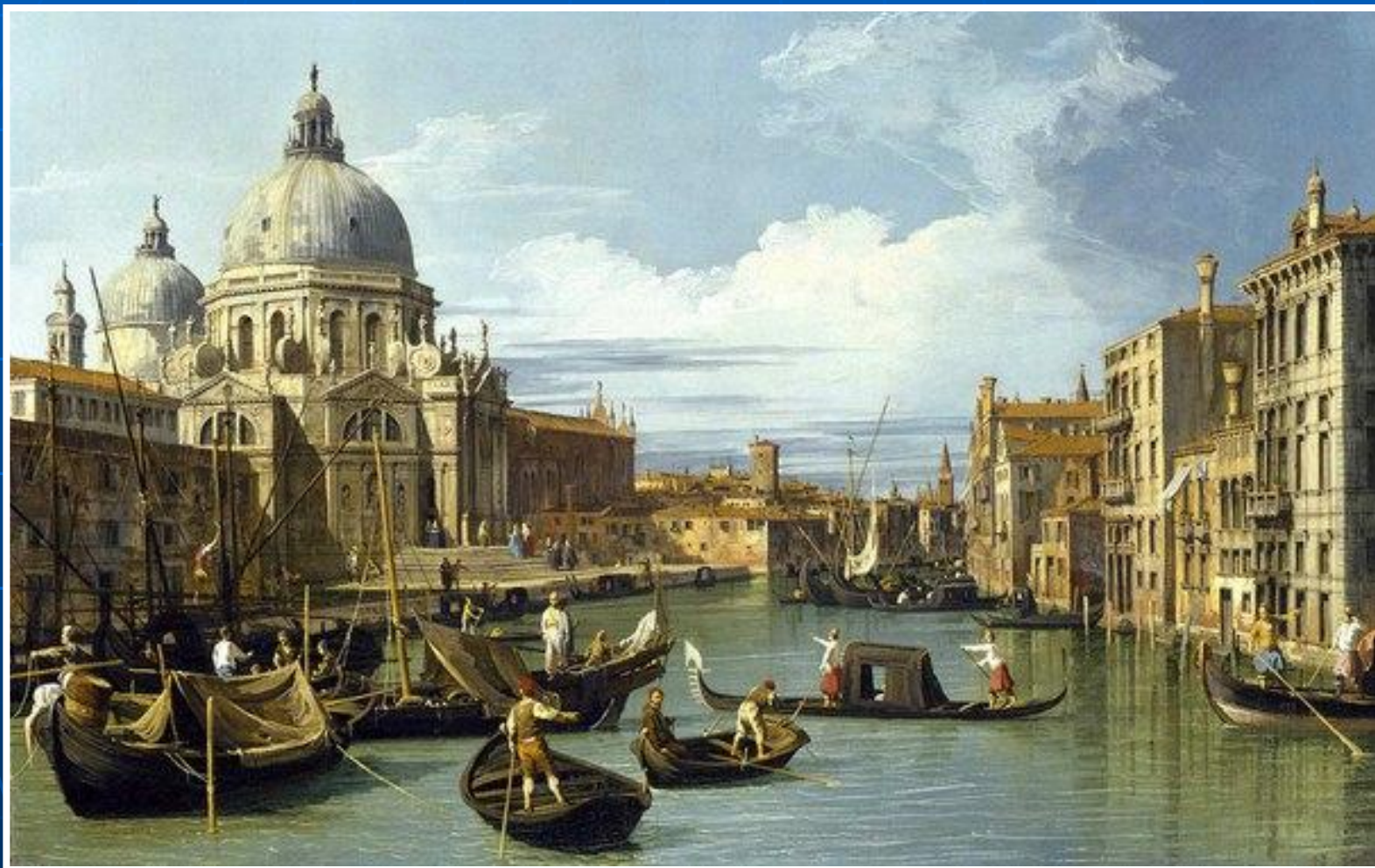
«Большой канал и Собор Санта-Мария делла Салюте» Джованни Антонио Каналлето

Потом появились мастера, которые, наоборот, создавали очень точные панорамные городские пейзажи. Они получили название ведута.