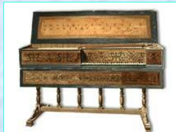
Вёрджинел. Нидерланды. 16 век