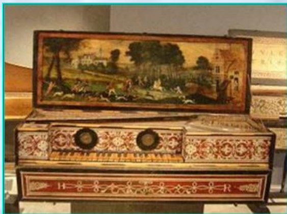
Фламандский вёрджинел Музей Музыки, Париж, Франция

Был распространен в 16-17 веках в Нидерландах и Англии. В 18 веке был известен и в Германии.