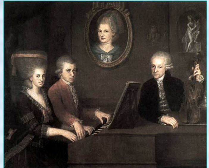
Семья Моцарта. 1780