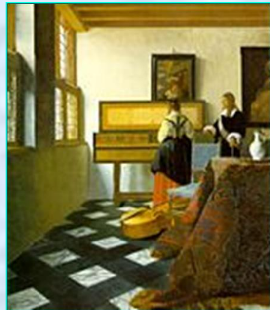
Картина Вермеера «Урок музыки» (около 1662)