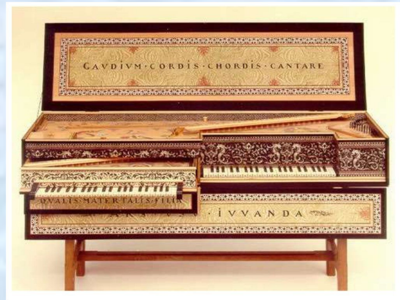
Двойной клавир. Германия. 17 век