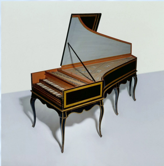
Немецкий клавесин. Начало 18 века