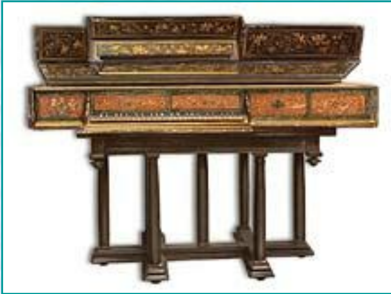
Вёрджинел королевы Елизаветы Англия. 16 век