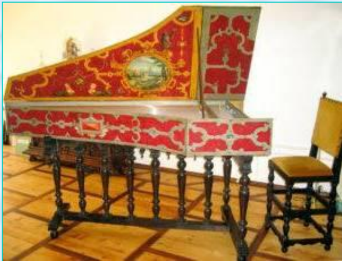
Копия фламандского клавесина

Клавесин имеет форму продолговатого треугольника. Его струны расположены горизонтально, параллельно клавишам.