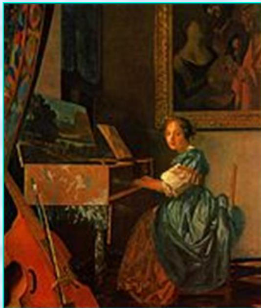
Картина Вермеера «Дама за мюзеларом» (около 1672)

МЮЗЕЛАР — небольшой столообразный фламандский клавишный струнный музыкальный инструмент, разновидность клавесина. Имеет один набор струн и один мануал (клавиатуру), сдвинутый вправо от центра.