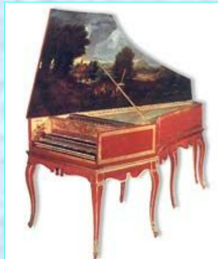
Клавесин. Англия. 18 век