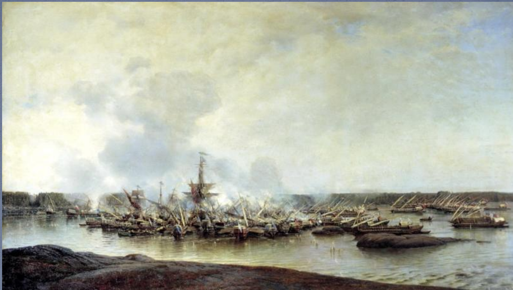
БОГОЛЮБОВ А. - Сражение при Гангуте 27 июля 1714 года,