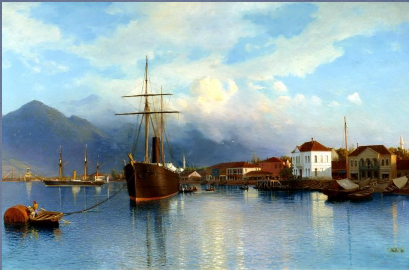
ЛАГОРИО Лев - Батум