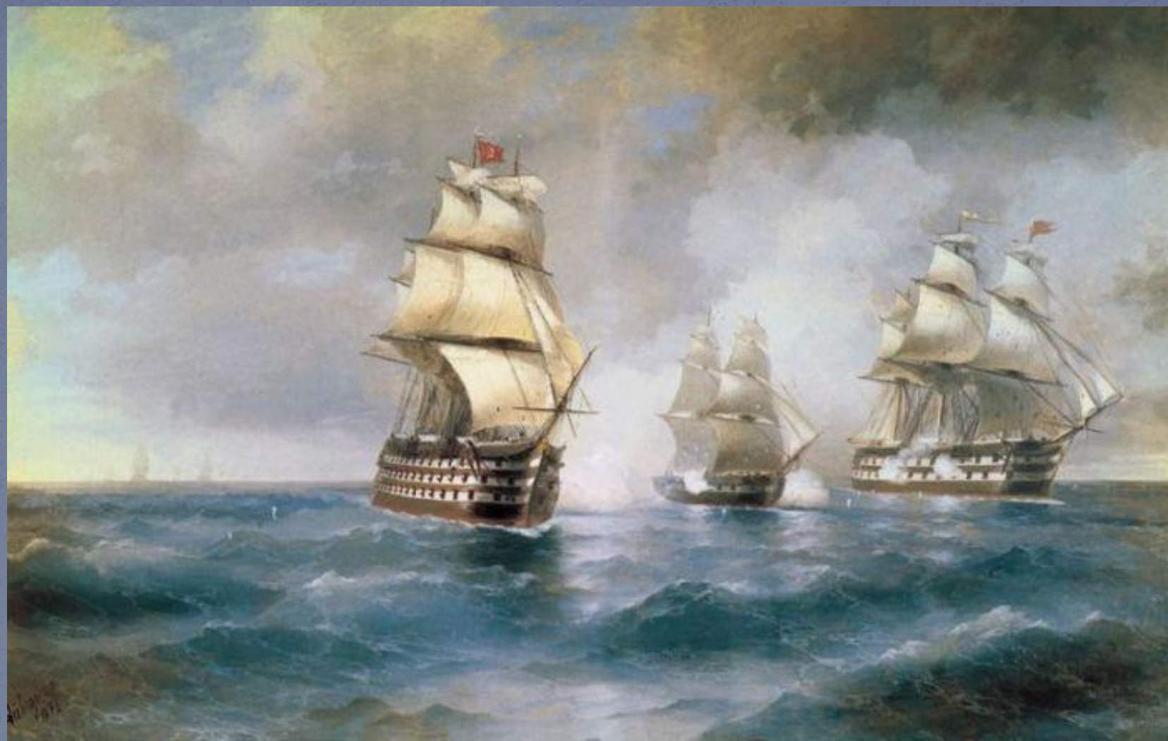
И.К. Айвазовский Бриг «Меркурий», атакованный двумя турецкими кораблями, 1892