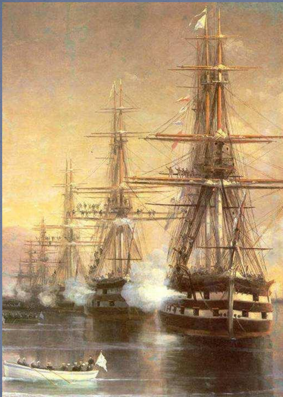
И.К. Айвазовский Высадка в Субаши