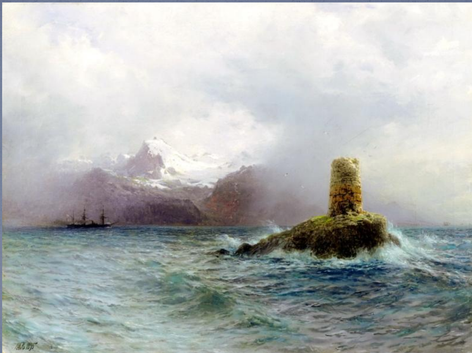
ЛАГОРИО Лев - Лафотенский остров