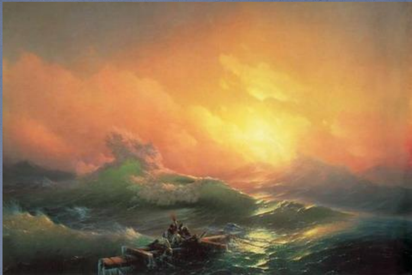
Девятый вал, 1850