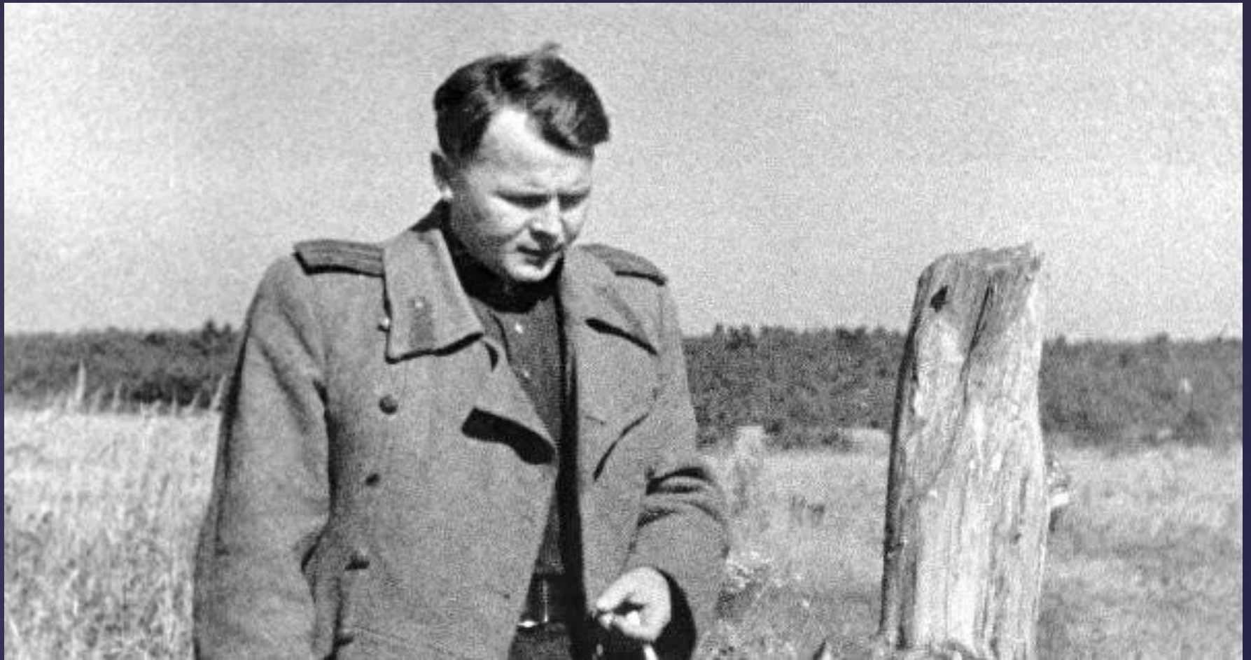
Твардовский Александр Трифонович. 110 лет со дня рождения, в Год памяти и славы.