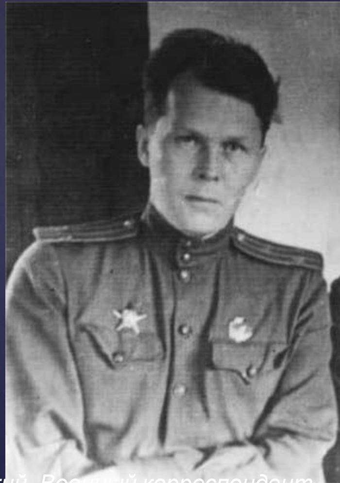
Твардовский- Военный корреспондент

После окончания, в 1939г. Московского института философии, литературы и истории (ИФЛИ), Твардовский был призван в армию как военный корреспондент. За 6 лет армейской жизни прошёл несколько войн – польский поход Красной армии, советско – финская война, Великая Отечественная война. Свою фронтовую лирику он называл «Фронтовая хроника». Создал произведения снискавшие народную любовь. Главную из них – «Василий Теркин» - писал на протяжении всей войны. Главный герой – собирательный образ советского солдата, близок каждому русскому человеку.